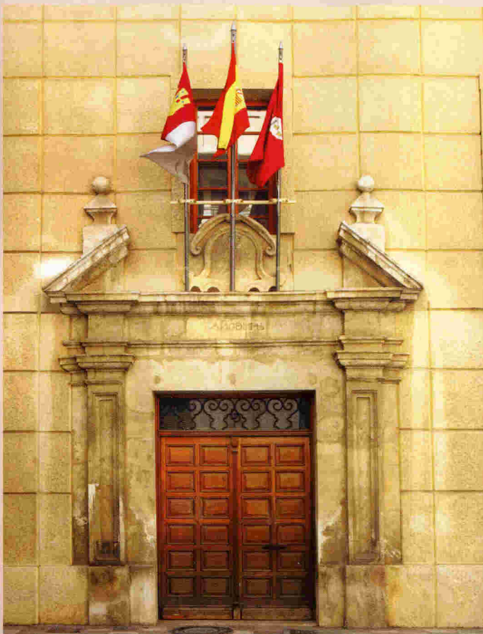
Portada del antiguo convento (1741) (calle Padre Romano)