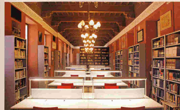
Biblioteca "Tomás Navarro Tomás" del I.E.A.