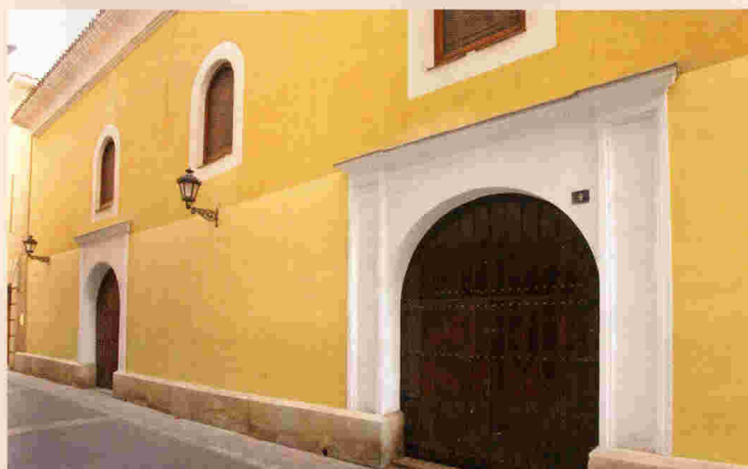
Lateral en la calle de Las Monjas