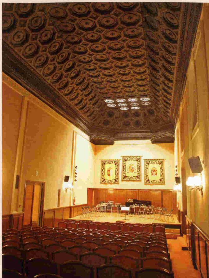
Salón de Actos