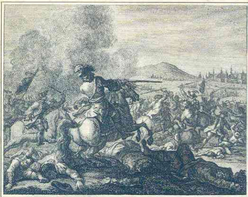
Batalla de Almansa (grabado). Siglo XIX.