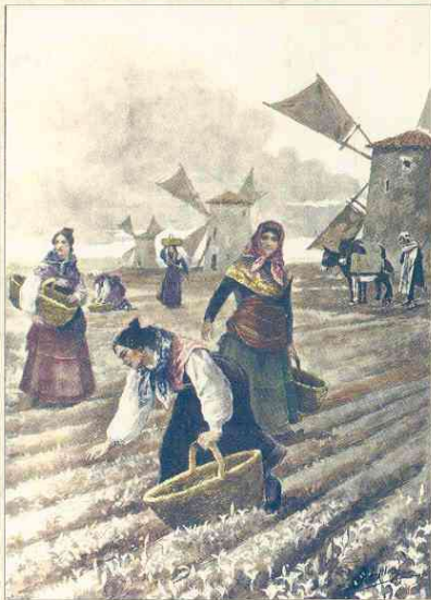
La recolección de azafrán en La Mancha (dibujo, M. Alcázar, litografía coloreada), Siglo XIX.