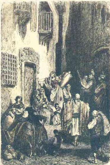
Calle de Albacete (dibujó de Gustavo Doré. Litografía editada por Heracleo Fournier) Siglo XIX.