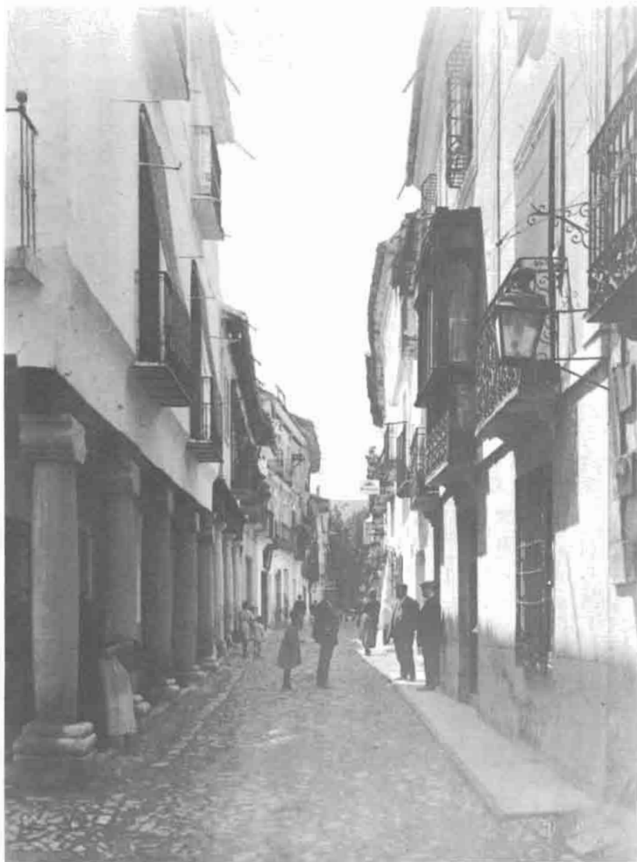
La calle Mayor. (1900 Belda).