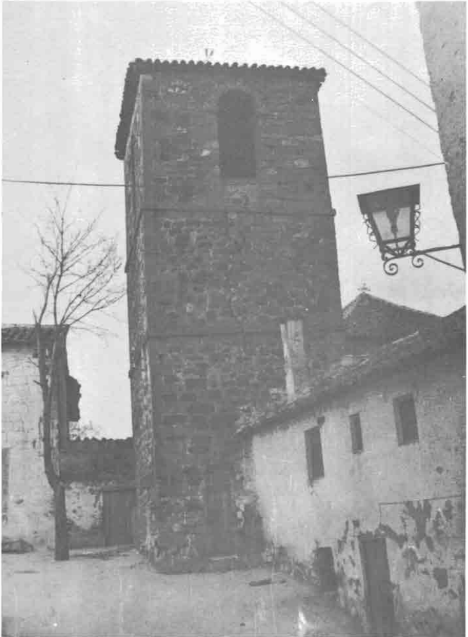
La torre de San Miguel, uno de los monumentos más antiguos de Alcaraz, fue testigo de los sucesos de 1458.