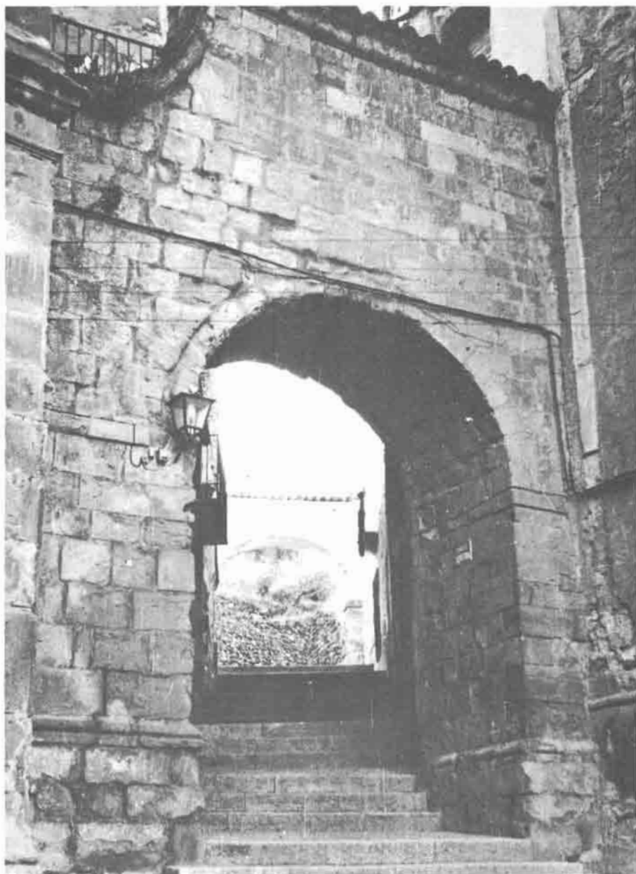
Alcaraz, arco de la Zapatería, que desde la Plaza Mayor da acceso a la "plazuela de Arriba" y al alcázar.