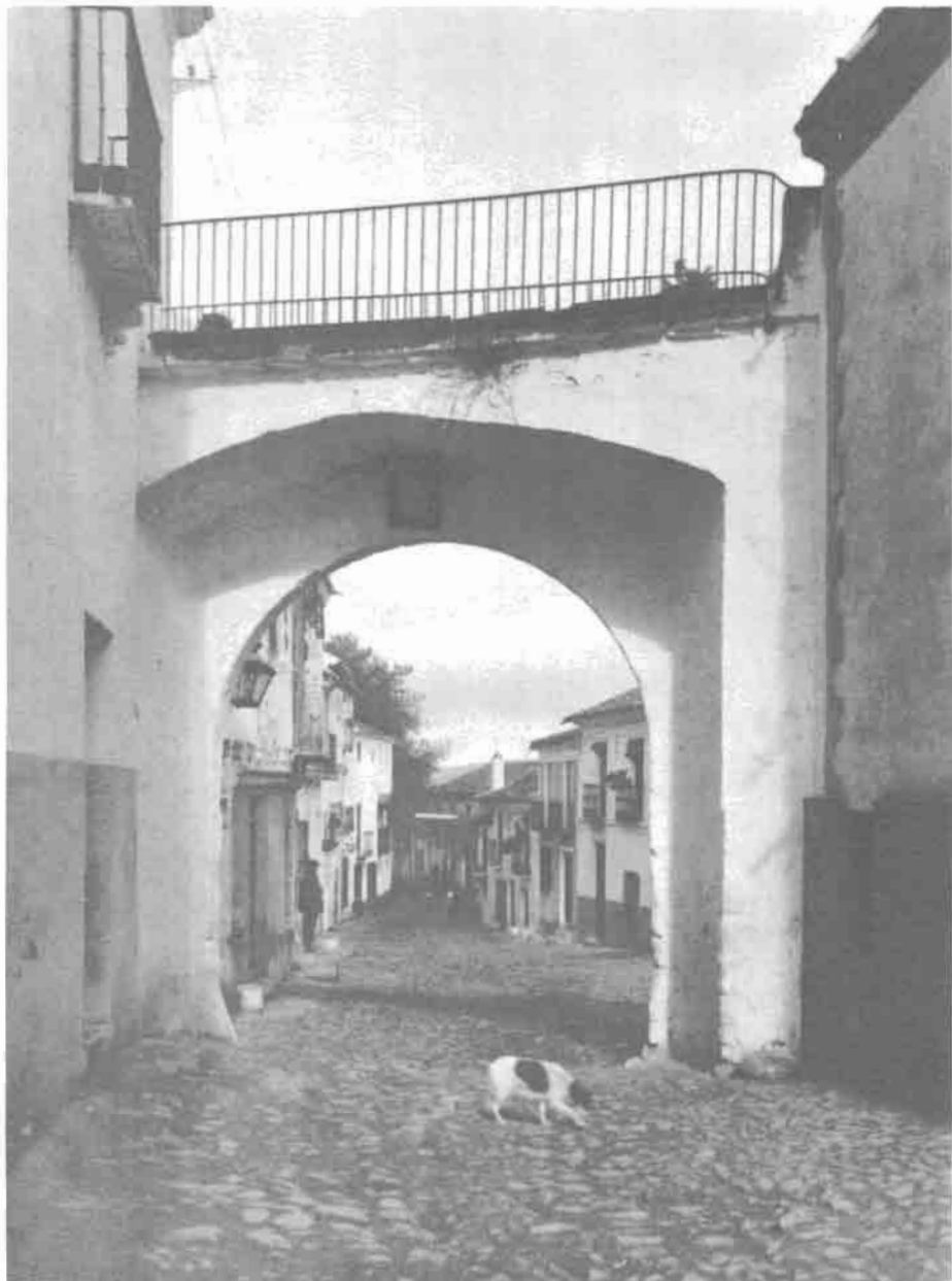
Arco de la Puerta Nueva.