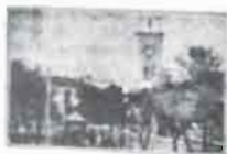
Plaza de la Constitución