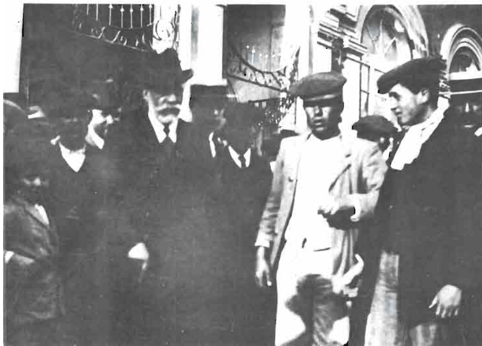
PABLO IGLESIAS EN ALBACETE. La prensa socialista estuvo presente en el estadio de la prensa local desde 1910 con El Socialista de Albacete. Después aparecieron otros periódicos de la misma ideología como El 13, Libertad y Patria, El 13 de Albacete, Tierra o Vanguardia.