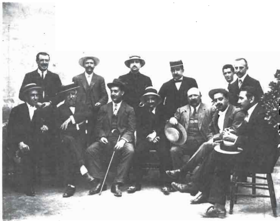
En esta fotografía, que publicó Alberto Mateos Arcángel ( Del Albacete Antiguo . Albacete, I. E. A., 1983), podemos contemplar a algunos de los periodistas albacetenses de comienzos de siglo.