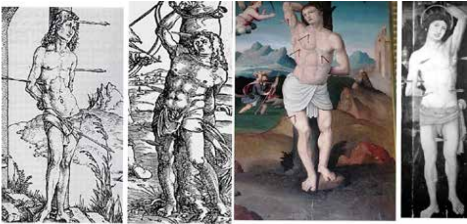
Fig.11.- Grabados de Dürero, Baldung Grien , San Sebastián de Letur y en una tabla de Miguel Esteve (detalle).

plasmar un cuerpo bello ,aunque chato, y debe estar inspirado en alguna estampa (para él italiana), evocando (posición de su brazo izquierdo) el esclavo moribundo (c. 1513) de Miguel Ángel en el Museo del Louvre 34 .