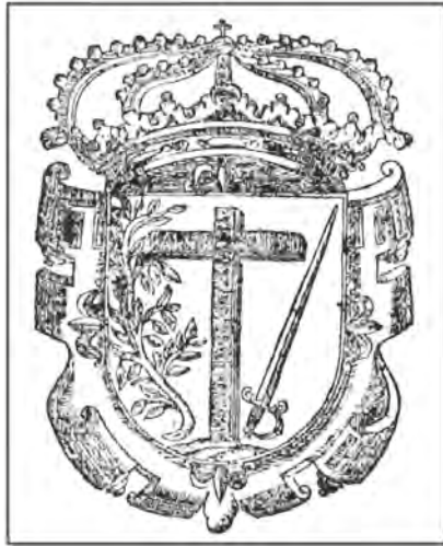
Escudo de la Inquisición.

principio quedaba sujeta a la autoridad del Tribunal, aunque su jurisdicción se extendiera más tarde a otras áreas.