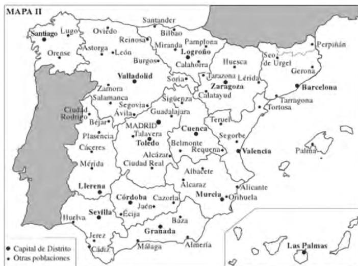
Mapa II. Demarcaciones inquisitoriales hacia 1570