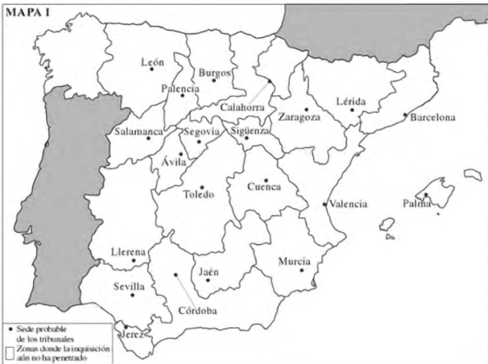
Mapa I. Demarcaciones inquisitoriales hacia 1492

Poco después, en enero de 1489, los Reyes Católicos pedían a los concejos del obispado de Cuenca que recibieran a los inquisidores designados para ejercer en esta ciudad. El Tribunal conquense, cuya jurisdicción también incluía las tierras santiaguistas dependientes de Uclés, tuvo potestad, como se ha señalado, sobre las actuales poblaciones albacetenses de Minaya, La Roda y las aldeas de sus términos, así como sobre el lleco de Madrigueras y Tarazona 11 . Muy pronto (1494) los inquisidores de Cuenca iniciaron sus actividades en La Roda con el procesamiento de miembros de la familia Salas, tal como ha revelado y analizado en profundidad García Moratalla 12 .