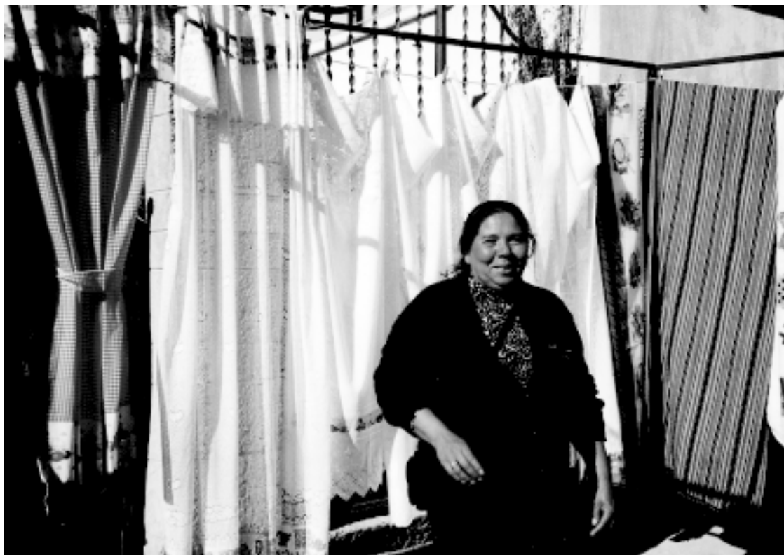
Una gitana en el mercadillo de Letur, en el año 2000

se montaban y disimulando le pinchaban en las cruces (entre los omoplatos) y así el animal corría, porque le molestaba. Si era viejo, le quitaban años (como hacemos las mujeres). No nos podíamos fiar mucho. Siempre querían vender mucho más caro de lo que lo habían comprado.