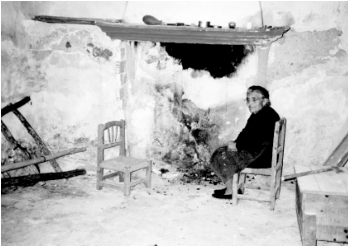
En el humero

potable en las casas. La buscábamos en cántaros en la acequia que baja del monte, yendo muy arriba para cogerla limpia. De tanto bajar con los cántaros puestos en el lado derecho de la cadera se le rompió la ropa a mis hijas.