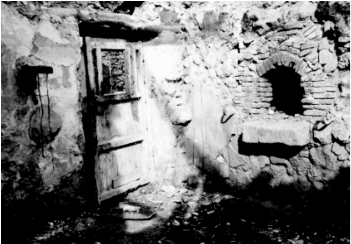
El horno público de Los Lirios en el año 1990