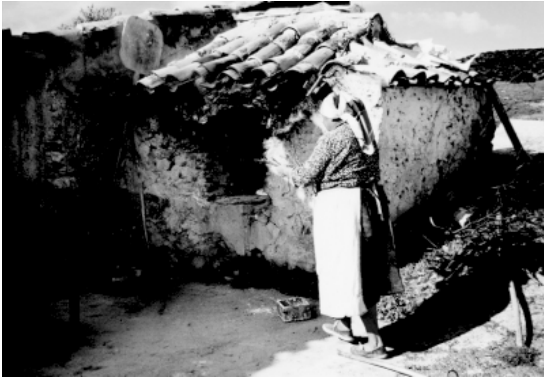
Cociendo pan en un cortijo de la sierra

la calle alrededor del horno y la barría, para que en el momento de echar el pan, ningún aire levantara polvo. Así no lo hacían todas, pero mi madre tenía un sentido especial de hacer las cosas ordenadas, limpias y de prisa, y quería que siguiéramos su ejemplo.