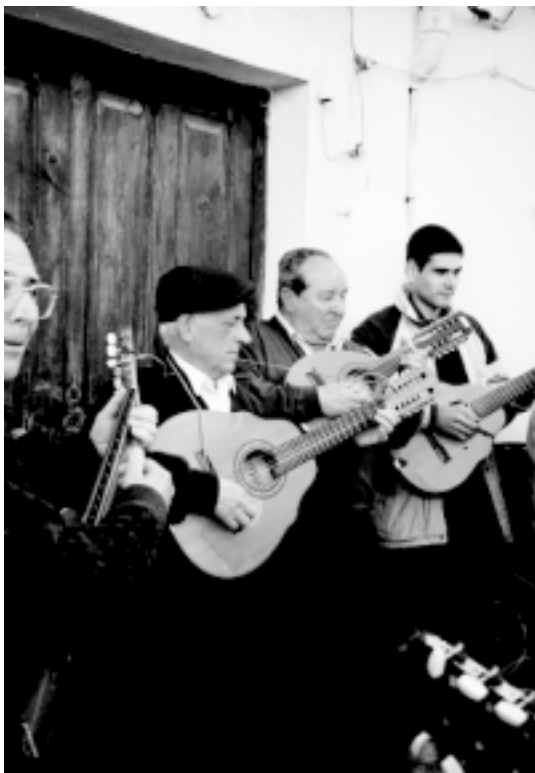
Pidiendo el aguinaldo

el trigo, la hortaliza y los frutales. Los labradores seguían esa costumbre seguramente porque creían que servía para algo. Yo recuerdo unas veces que vino el cielo como noche, el granizo cayendo, que se partía la nube y se iba a la montaña a descargar. Pero no siempre era así.