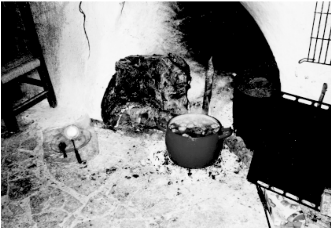
El Tocón de Navidad en el humero de Práxedes

En las aldeas se tenía la costumbre de para la Nochebuena poner un tocón muy gordo en la lumbre para calentarse toda la familia mientras cenaban, y para que siguiera ardiendo toda la noche.