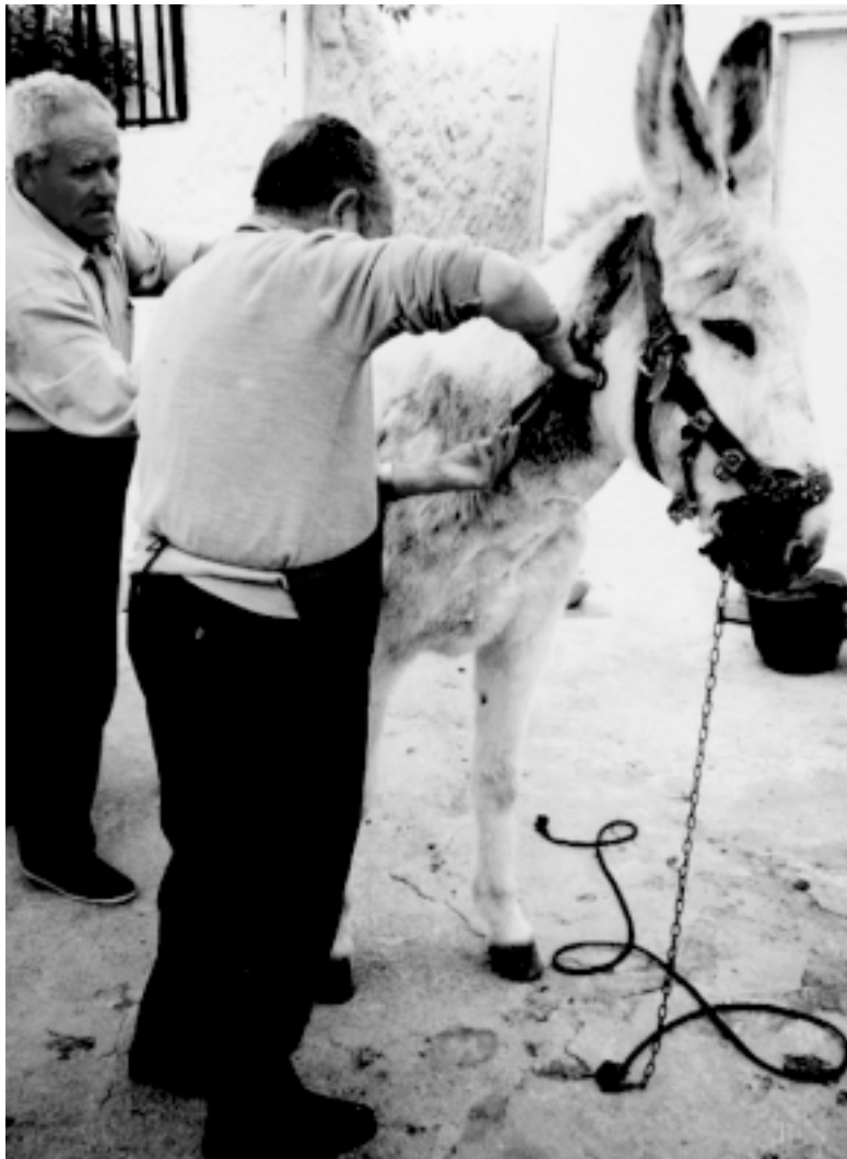
Haciendo la raya con las tijeras

ba nada. Esta era una cocina grande y un dormitorio que no servían. La puerta era de dos hojas, servía también de ventana. Dentro nos alumbrábamos con teas de pino o de candiles de aceite. Pero más con teas porque allí había pocos olivos y mucho monte. Luz eléctrica no había en Los Collados.