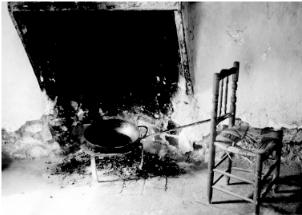
La cocina abandonada