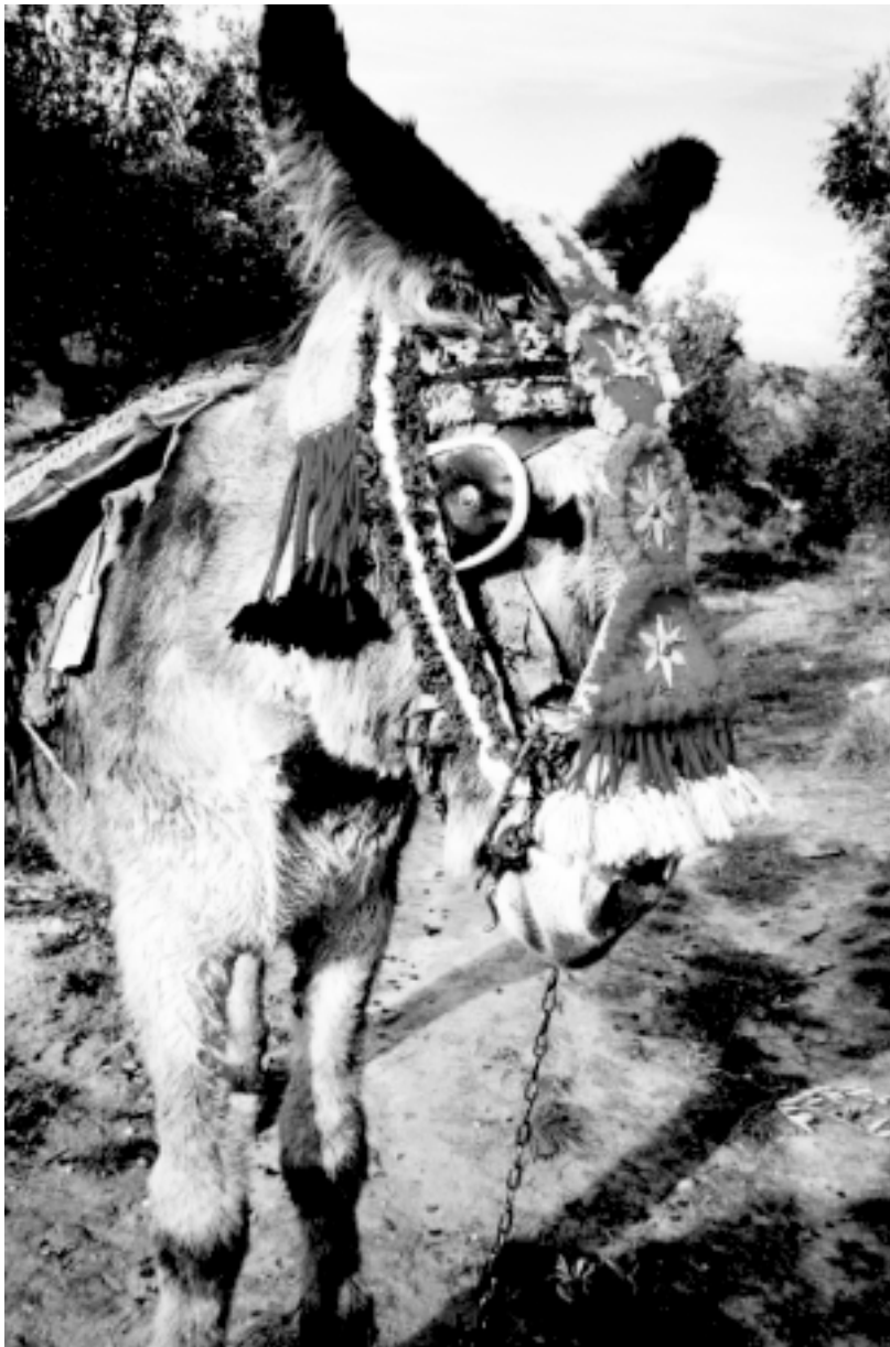
El burro del Antolín de fiesta

cha de la obra, hecho por él mismo, y llevaba una cuerda metálica muy fuerte que se pasaba por otro torno a la otra orilla en frente, y volvía, igual que las cuerdas para