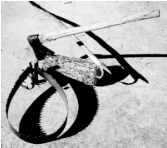
Herramientas: la sierra, el hacha y el gancho

demás de Yeste. Dormíamos en el cortijo de La Longuera en los pajares; cruzando el río andando el agua llegaba a media piana, fría como el granizo. Tuvimos a nuestra disposición una casa desocupada con su cocina. Había un ranchero encargado de la comida.