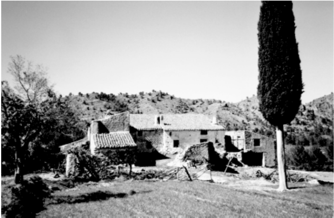
El cortijo de La Alberquilla