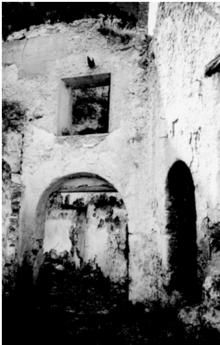
La calle Los Cárabos en 1989

Ropa para vestirse tenían muy poca, no se la podían comprar. Había personas que