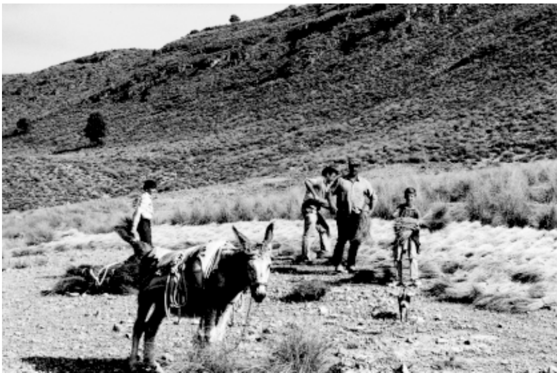
Una familia de Elche cogiendo esparto en agosto de 1981

¿Cuántas horas segábamos? Pues se trabajaba de sol a sol. Dos horas para comer y echar un rato de siesta. A la una a comer y a las tres a enganchar. El sol en este tiempo sale a las cinco o las seis, y se pone a las nueve. Esto hace trece horas segando. Dolía la espalda y los riñones.