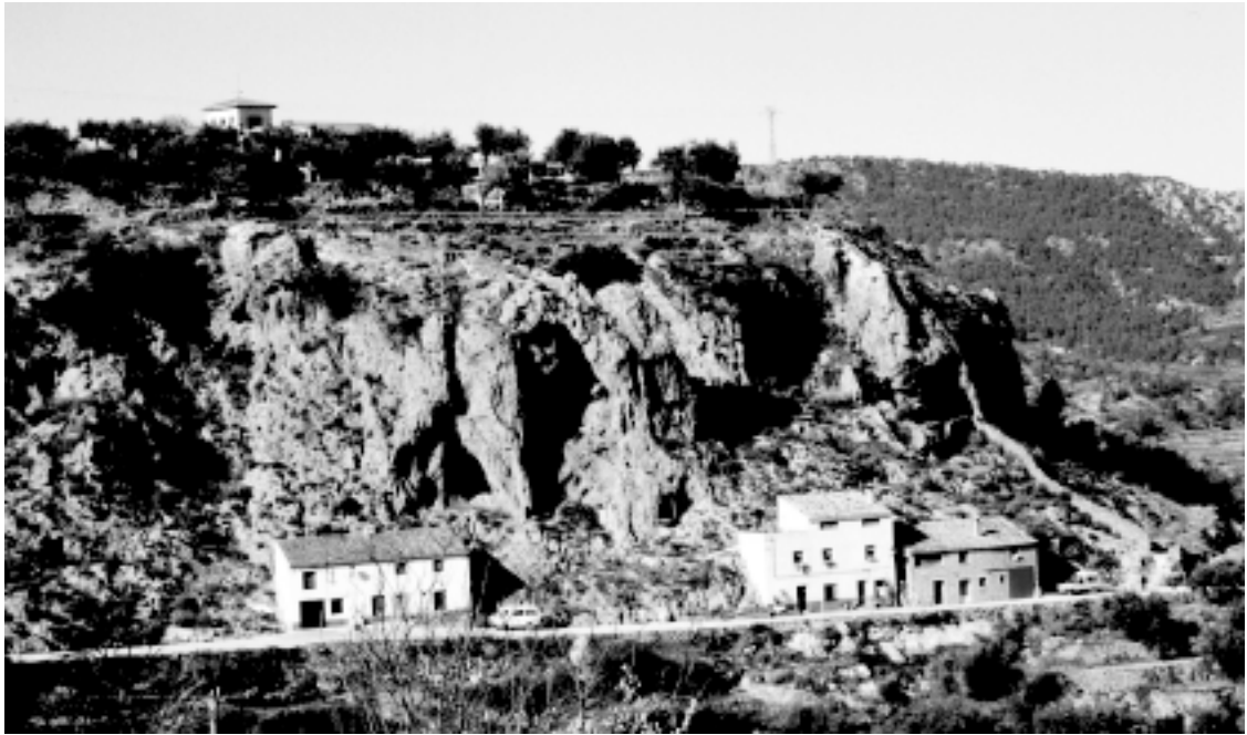
Las Cuevas en El Llanico Perales

ron por la parte de Hellín y también a Elche de la Sierra. Por los años cincuenta ya no se veían gitanos por aquí. El plástico había aparecido en el mercado y las canastillas ya no se vendían. Ahora los gitanos se dedican a la compra y venta de ropa, retales y cosas de segunda mano. Compran en las ciudades y van a todos los mercados de pueblo.