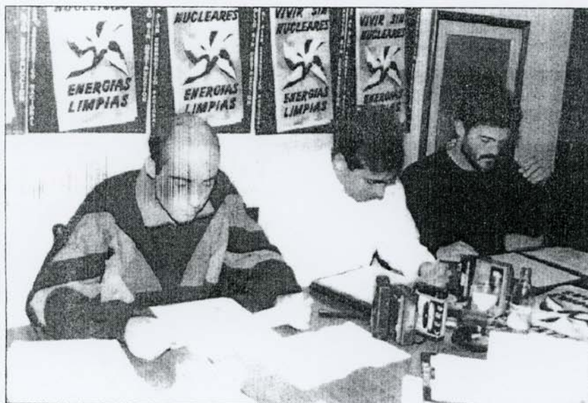
Miembros de Aedenat en la presentación de la campaña "Vivir sin nucleares".

Miembros de Aedenat expresaron que "todos los informes realizados por distintas asociaciones ecologistas, coinciden en que existe una íntima relación entre el gasto energético y el