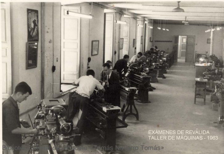
EXÁMENES DE REVÁLIDA TALLER DE MÁQUINAS - 1963