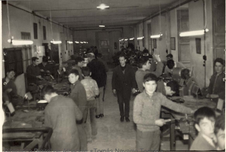
Biblioteca Digital de Albacete «Tomás Navarro Tomás» TALLER DE AJUSTE - 21/2/1964