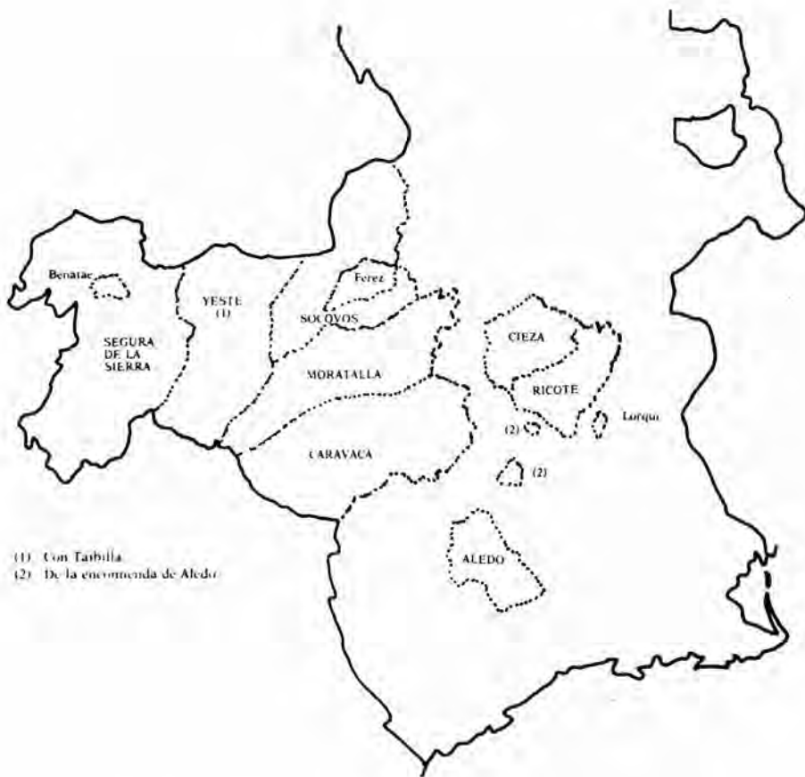
MAPA N.º 2 Encomiendas de la Orden de Santiago en el reino de Murcia (1440-1515).