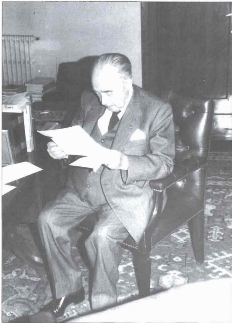
En el despacho del Grupo Socialista del Senado, revisando la correspondencia.