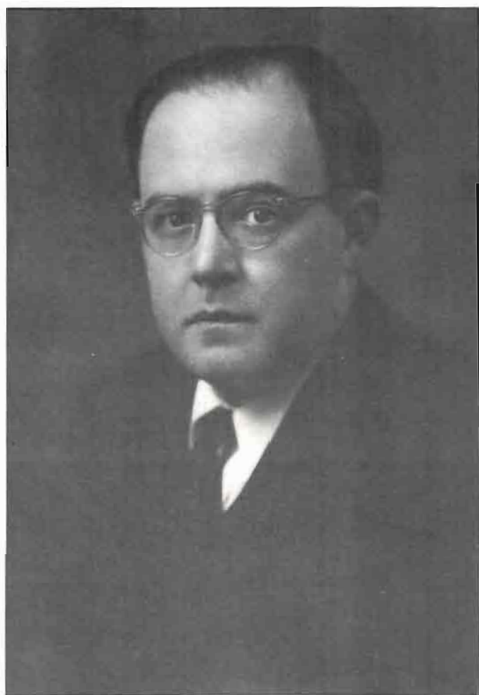
Retrato tras llegar a Bogotá (1931).