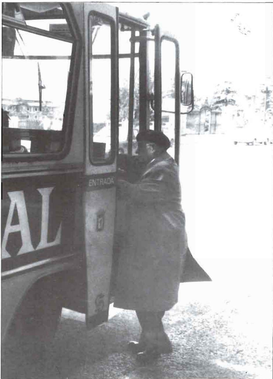
En la madrileña Plaza de Oriente, subiendo al autobús que suele conducirlo desde el Senado hasta su casa.