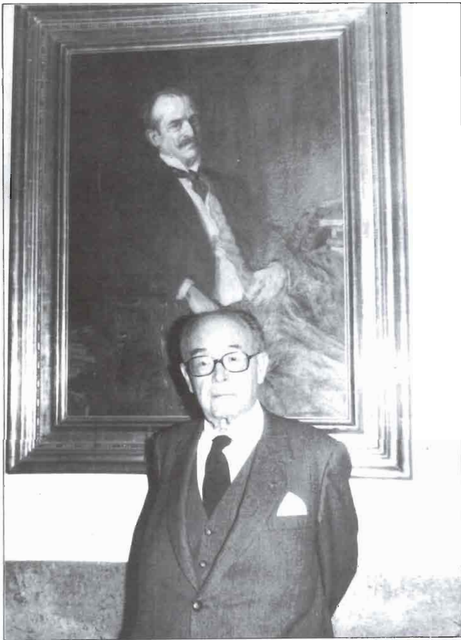
En el Senado, ante el retrato de Romanones.