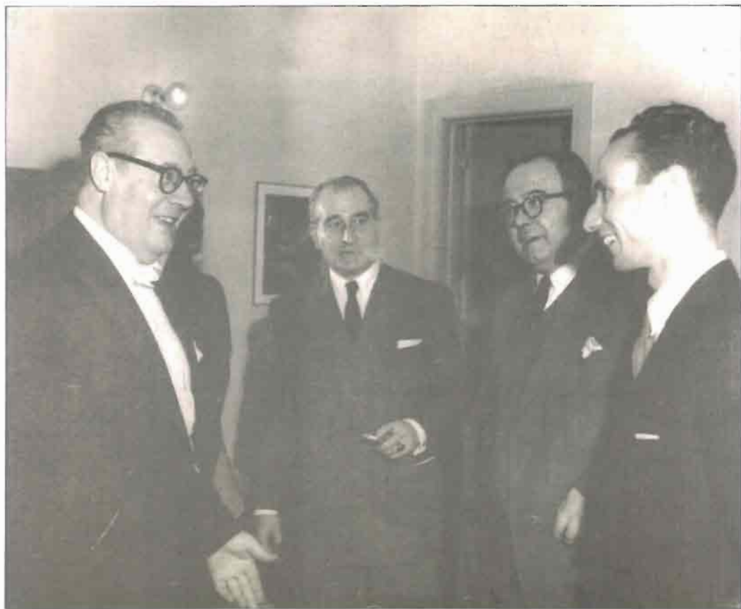
Junto a Andrés Segovia, el periodista español Retama y Gil Tovar, en un concierto celebrado el 13 de abril de 1953 en el Teatro Colón de Bogotá.