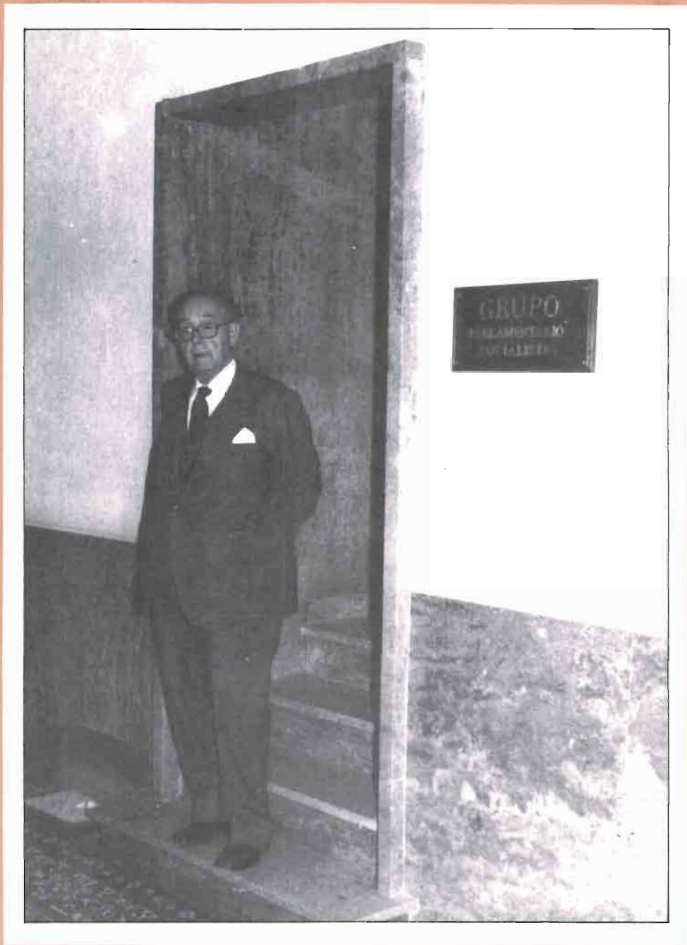
A la puerta del despacho del Grupo Socialista, en el Senado (1985)