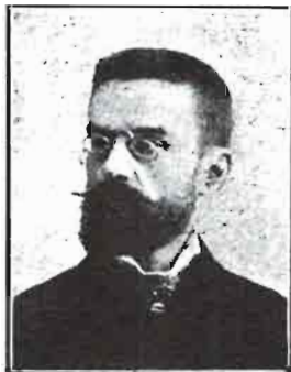
DIRECTOR-PROPIETARIO D. TOMÁS SERUA

— Precios convencionales según inserciones —