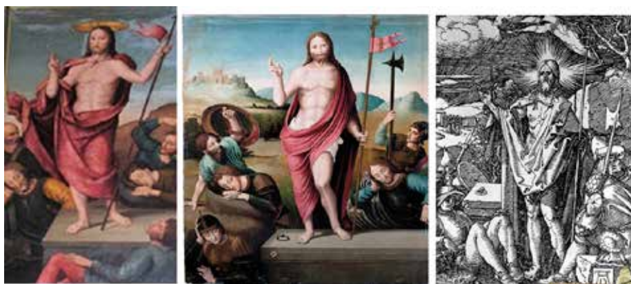
Fig.9.- Resurrección de Letur, del retablo de la Capilla de los Llanos de la catedral de Albacete y grabado de Alberto Durero.

La composición deriva de la de Hernando Llanos en uno de los paneles del retablo mayor de la catedral de Valencia y es afín al mismo asunto que nuestro pintor llevó a cabo en el retablo de la capilla de la Virgen de los Llanos de la seo de Albacete, este último más cercano a Hernando Llanos. Todas ellas tienen un claro precedente en la xilografía del mismo tema de Durero en su Pequeña Pasión (1509-1511) (Fig. 9).