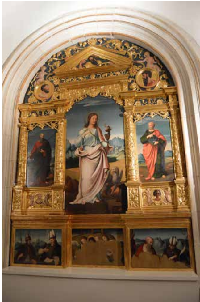
Fig.17.- Retablo de San Juan de la Clastra. Museo de la catedral de Murcia.

En las obras del Maestro de Albacete ( y especialmente en las de la parroquial de Letur), sus composiciones, tipos humanos y fondos de paisaje, guardan muy estrechas relaciones con el único trabajo conservado y al parecer documentado de Andrés de Llanos, el hermano menor de Hernando Llanos: el retablo de San Juan de la Clastra de la catedral de Murcia, que se pintaría en 1545 (Fig. 17).