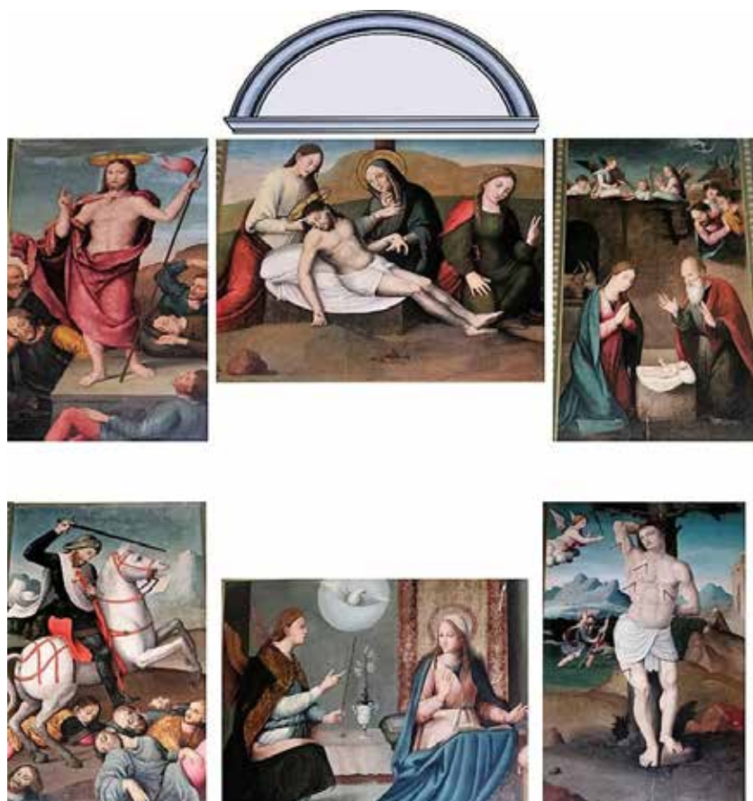
Fig.2.- Disposición original de las tablas en el antiguo retablo mayor.

En tiempos de Amador de los Ríos se conservaba también en la iglesia un “sencillo y elegante retablo plateresco primitivo” –al parecer en la Capilla de la Inmaculada–, de líneas clásicas y frontón triangular, con una sola hornacina en el centro. En el friso del entablamento, en capitales latinas de oro, se leía: LUCIA SPONSA CHRISTI 21 . Por lo que hay que deducir que estaba dedicado a Santa Lucía, aunque en ese momento mostraba una de esas industriales esculturas modernas, según palabras del mencionado investigador, de la Inmaculada Concepción.