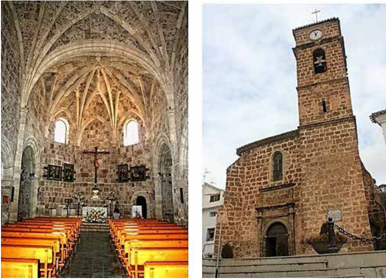
Fig.1 Iglesia parroquial de la Asunción de Letur (cabecera y exterior del edificio).