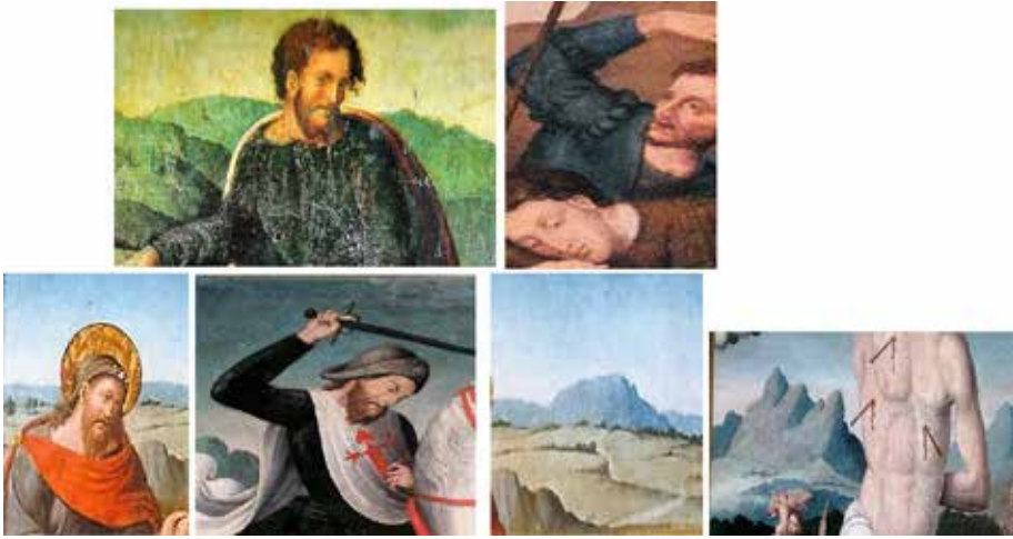
Fig. 16.- Detalle personaje en la tabla de la Traslación del cuerpo de Santiago (MUBAM) y soldado de la Resurrección de Letur. Detalle del rostro de Santiago en la Predicación de Santiago (MUBAM) y el Santiago matamoros de Letur. Paisaje en la Predicación de Santiago y en el San Sebastián de Letur.

Como hemos advertido algunas de las composiciones de las tablas de Letur están basadas en grabados, en ocasiones combinando detalles de unos y otros. La dependencia de los Hernando, Yáñez y Llanos, se mitiga, quizá porque las obras que comentamos están ya lejanas en el tiempo a la producción de estos pintores.