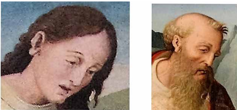
Fig.19.- Lóbulos de las orejas de San Juan en la Piedad de Letur y y en el San Jerónimo en el retablo de San Juan de la claustra (Museo de la catedral de Murcia).