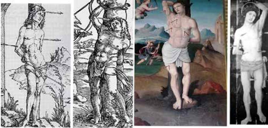
Fig. 11.- Grabados de Dürero, Baldung Grien , San Sebastián de Letur y en una tabla de Miguel Esteve (detalle).

plasmar un cuerpo bello ,aunque chato, y debe estar inspirado en alguna estampa (para él italiana), evocando (posición de su brazo izquierdo) el esclavo moribundo (c. 1513) de Miguel Ángel en el Museo del Louvre 34 .