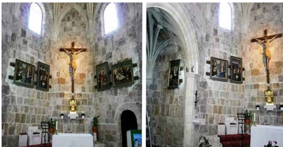
Fig.3.- Las tablas en su actual emplazamiento en el templo.