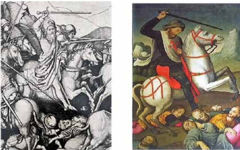
Fig.15.- Grabado de Santiago en Clavijo de Martin Shongauer (detalle) y Santiago de Letur.

La figura de Santiago a caballo parece inspirarse en grabados de la batalla de Clavijo del alemán Martin Shongauer (1448-1491) y la repitió el Maestro de Albacete/Juan de Vitoria en el fondo de la tabla de Santiago, que se conserva en Alcaraz (Fig. 15).