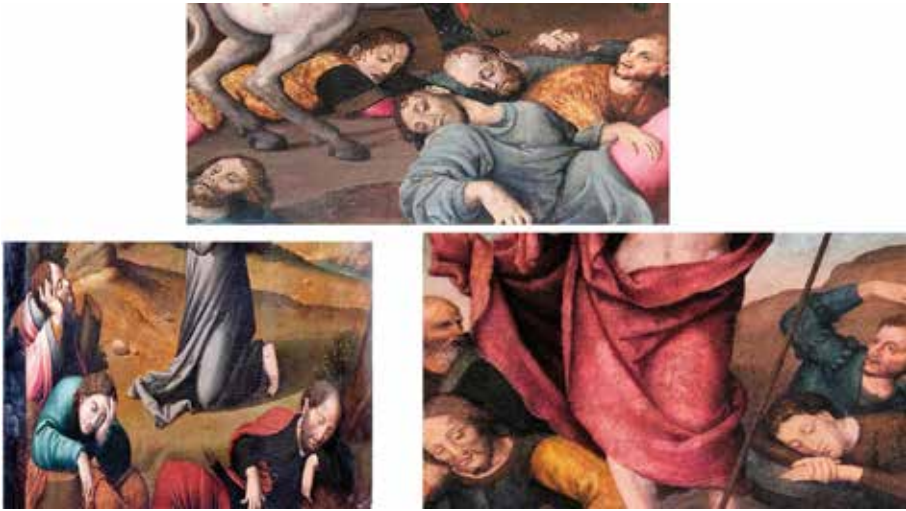
Fig.14.-Detalles de los moros vencidos en la tabla de Santiago de Letur, apóstoles de la Oración en el huerto del retablo de capilla de la Virgen de los Llanos de la catedral de Albacete y soldados de la Resurrección de Letur.

La figura de Santiago a caballo parece inspirarse en grabados de la batalla de Clavijo del alemán Martin Shongauer (1448-1491) y la repitió el Maestro de Albacete/Juan de Vitoria en el fondo de la tabla de Santiago, que se conserva en Alcaraz (Fig. 15).