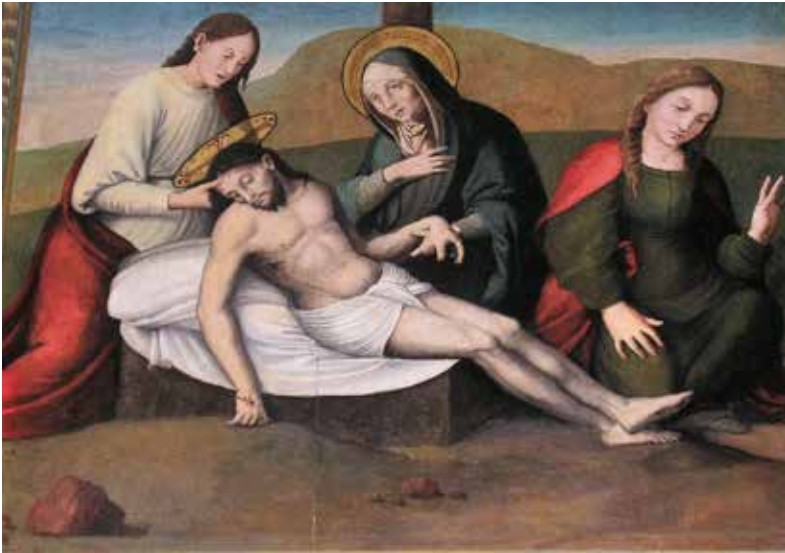
Fig. 7.- Piedad.

En la Piedad (92 x 111 cm), en un paraje crepuscular y al pie del montículo donde se advierte el arranque de la Cruz, Cristo acaba de ser descolgado de la misma. Su cuerpo inerte y con paño de pureza, con la sangre coagulada que ha manado de sus heridas, reposa sobre una sábana y una piedra. Juan, a un lado, le sujeta la cabeza. Su madre, con nimbo y toca, le coge el antebrazo con una mano y lleva la otra al pecho con gesto triste. A los pies de Cristo, María Magdalena con manto rojo iza su mano izquierda (Fig. 7).