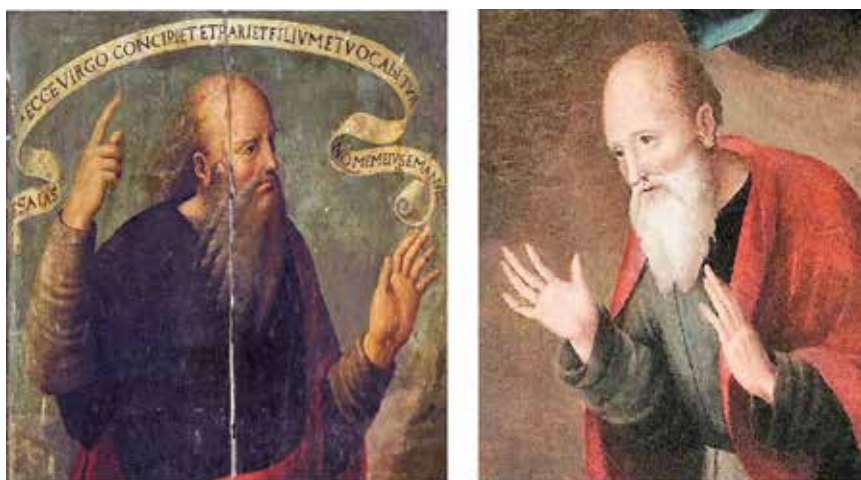
Fig.6.- Isaías del retablo de la capilla de la Virgen de los Llanos de la catedral de Albacete y San José del Nacimiento de Letur.

La composición del Nacimiento, del grupo principal de la Virgen, el Niño y San José es casi idéntica, aunque invertida, a la de la misma iconografía del Maestro de Albacete/Juan de Vitoria en la iglesia parroquial de Chinchilla, si bien en esta obra no se representa la adoración angélica y los pastores se asoman a través del muro en el exterior. Los tipos humanos, a su vez, son los habituales del pintor, como se comprueba al cotejar el de San José de la obra que tratamos con el de Isaías en la predela del retablo de la capilla de la Virgen de los Llanos en la catedral de San Juan de Albacete (Fig. 6). Los dos ángeles niños evocan los presentes en la Madonna sixtina (entre 1513 y 1514), de Rafael Sanzio en la Gemäldegalerie Alte Meister de Dresde que nuestro pintor pudo conocer a través de grabados.