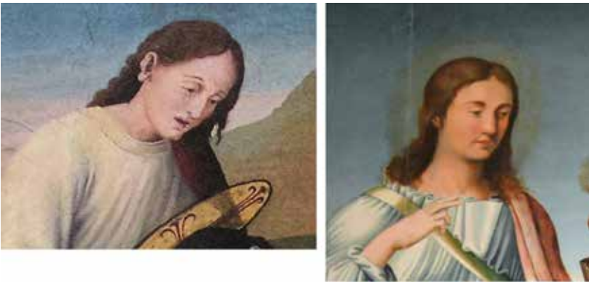
Fig.18.- Detalles de San Juan en la Piedad de Letur y en el retablo de San Juan de la Claustra (Museo de la catedral de Murcia).

Sirva de prueba para este argumento la identidad de modelos en ambas obras. Como el San Juan de la Piedad de Letur que repite el de San Juan Evangelista en el retablo del Museo de la catedral de Murcia (Fig. 18). El lóbulo alargado de la oreja del primero está concebido de la misma forma que el de San Jerónimo en la predela del conjunto murciano (Fig. 19). Los soldados dormidos, los moros muertos y los pastores de las tablas de Letur muestran el mismo flequillo corto y desaliñado que los ángeles en la Piedad de este último retablo, etc.