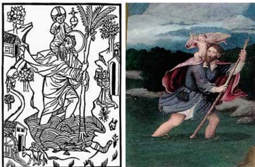
Fig.12.- San Cristóbal de Buxheim y en la tabla de San Sebastián de Letur.

Santiago matamoros (116 x 74 cm), con armadura, sobre su caballo blanco enjaezado y en corveta, arremete con espada larga contra los sarracenos, caídos por tierra, yacentes y muertos, con gotas de sangre en sus cabezas, salvo el que está vivo que es observado por el apóstol para ser rematado, tal como apareció en la batalla de Clavijo (año 844). Lleva estampada sobre su capa blanca la Cruz de Santiago, emblema de la Orden; una cruz de gules simulando una espada con forma de flor de lis en la empuñadura y en los brazos. Contrastan el negro del sayo y el rojo de la montura. En su gorro se advierte la concha de peregrino, en referencia a las peregrinaciones del denominado Camino de Santiago a la tumba del apóstol, descubierta poco antes, en el 813 (Fig. 13). Los moros vencidos evocan los apóstoles de la Oración en el huerto y los soldados dormidos de la Resurrección del retablo de la capilla de la Virgen de los Llanos en la catedral de Albacete 35 (Fig. 14). Son idénticos a los sayones derribados en la escena del martirio con la rueda en el retablo de Santa Catalina de la catedral de Orihuela.