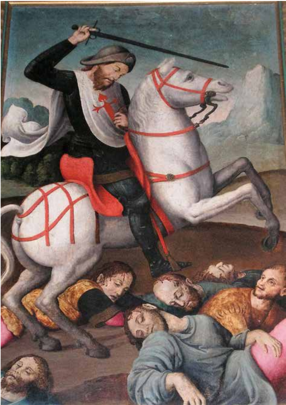
Fig.13.- Santiago en la batalla de Clavijo.