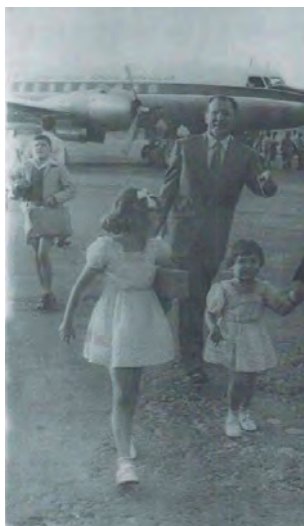
La España del exilio (AFAP).