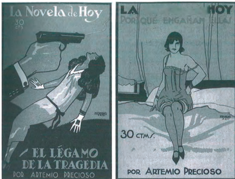
Portadas de novelas de Artemio Precioso García de los años veinte.

Con el aplastamiento de la República, su actividad democrática fue castigada por los nacionales. Fue detenido, y la petición fiscal de pena de muerte se resolvió finalmente con una condena a ocho años de prisión,