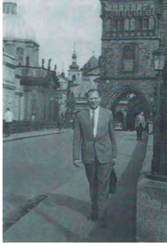
Profesor en Praga.

«Este es el punto de arranque para mi vida posterior y mi orientación política y sociológica. En mis estudios de la cátedra descubro que la clase obrera va perdiendo peso. Es decir: la predicción de Karl Marx no se cumple, en el sentido de que el capitalismo se resume en dos clases: la obrera y la burguesa. Hay una serie de clases intermedias que en el sector terciario tienen una gran influencia».