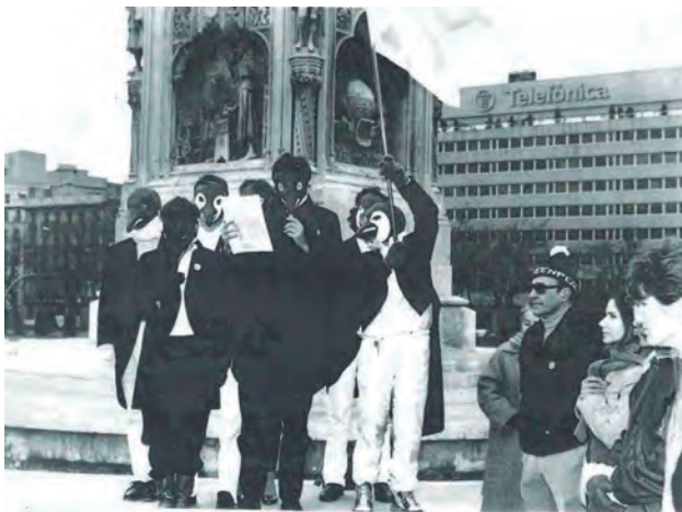
Protesta de Greenpeace.