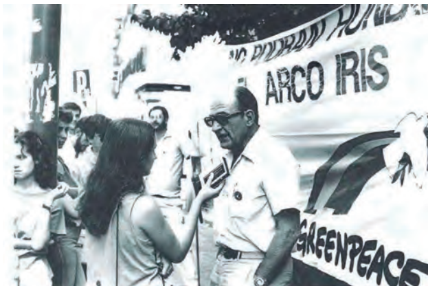
Protesta de Greenpeace.

de Al Gore consiguieran que los temas ambientales entraran en las páginas de información económica.