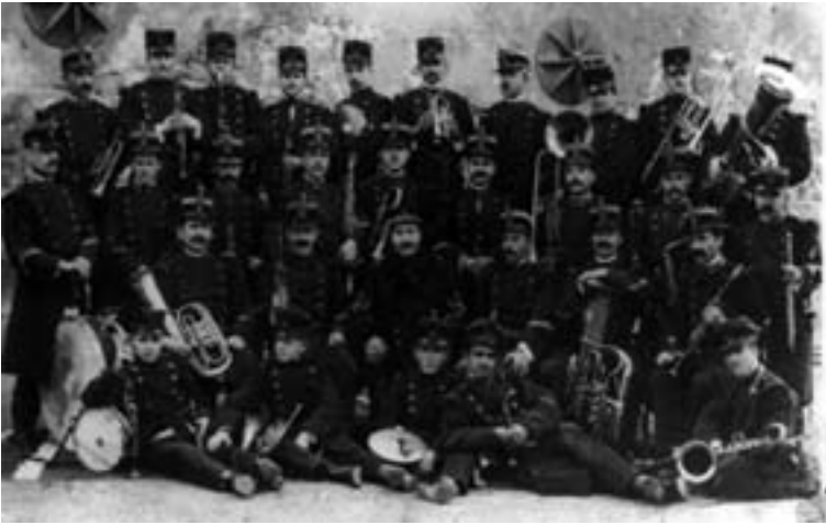
Banda de Música de Infantería de Marina, Cartagena, c. 1912.