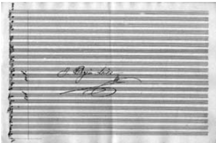
Orquestación de J.-P. Leive Márquez (3)