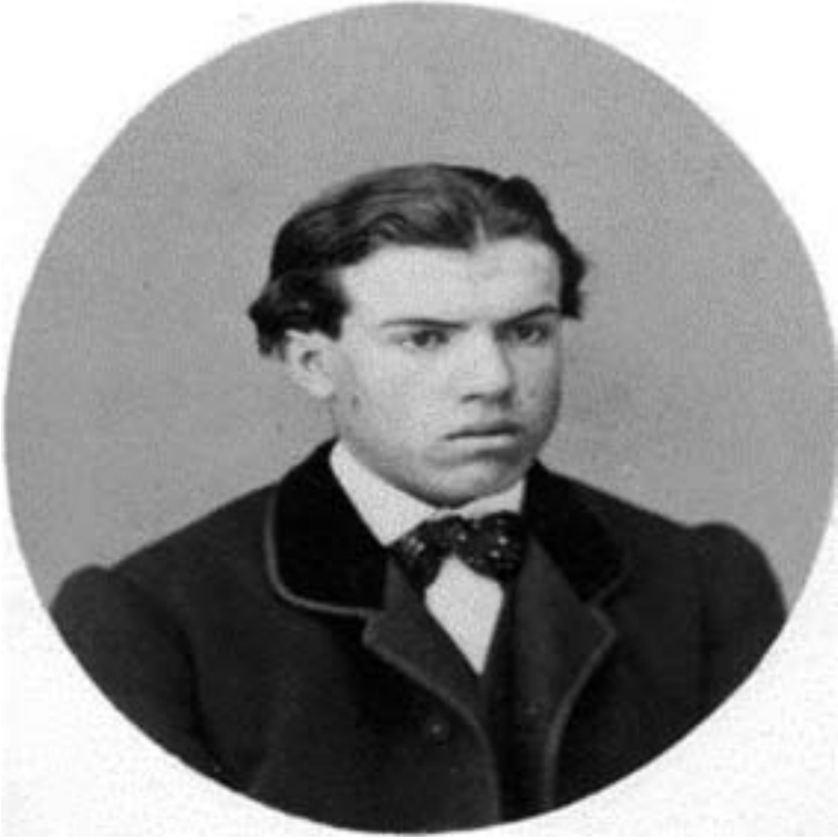
Antonio Mateos Negrillo (1857–1925).