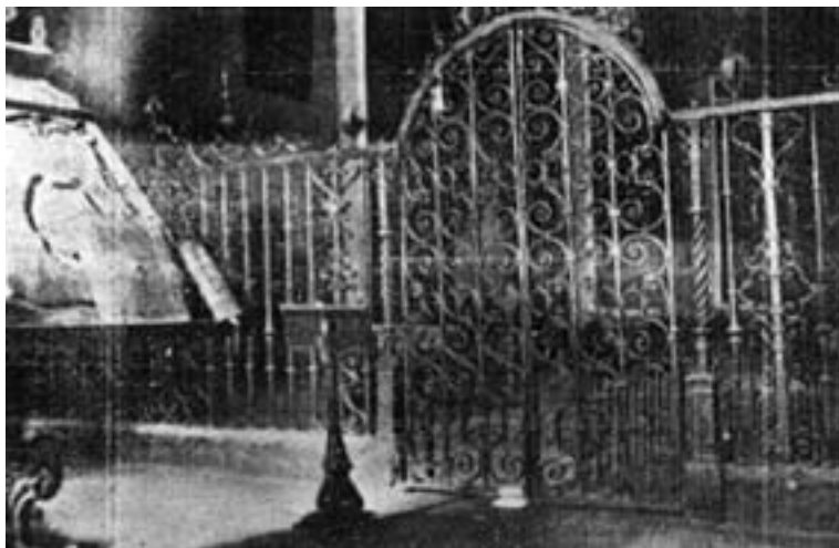
Única fotografía conservada del coro anterior a 1936, en la que se puede apreciar un fascistol y un atril así como la puerta cerrada y el arranque de la crujiá. (Revista "Centauro", Albacete, 6-12-1924)

Sin embargo esta ubicación no era la original, ya que cuando se construyó el órgano, en lugar del coro actual había una puerta al exterior 44 , y el coro estaba en medio de la nave principal, más próximo al Altar Mayor, y en un determinado momento se trasladó a su actual localización 45 .