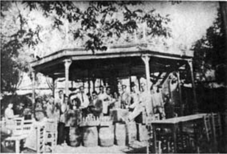
Imagen del “café–restaurant” ubicado en la parte baja del templete de la música en el Jardín–Feria en los años 1920.

explotación del establecimiento hostelero será un revulsivo para organizar la Banda ahora y posteriormente.