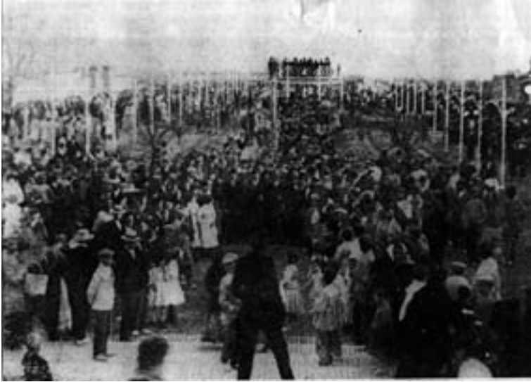
Inauguración del nuevo Jardín-Feria, con la Banda de Música ubicada en el templete central.1911.

El Jardín Feria tenía en el centro un templete o “tinglado para la música” 532 instalado el mismo año de su inauguración que en su parte inferior tenía un espacio destinado a café–restaurante. El Ayuntamiento sacó a subasta pública su explotación, comprometiéndose a que la Banda Municipal actuase regularmente o, en su defecto, que hubiera una rebaja en el precio del remate 533 , cosa que querían evitar a toda costa. La