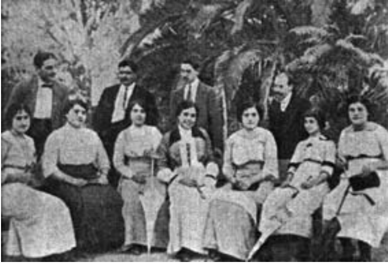
Escena habitual en el jardín de la Glorieta, a principios del siglo XX.

La Unión Musical desaparece alrededor de 1908, precisamente cuando el arrendatario del Teatro Principal y presidente de la agrupación, Juan Losada, trata de traspasar el remate de dicho coliseo 518 . La Banda Municipal inicia este año con una rebaja de sueldo de su director, entre otros empleados y acordada por el Ayuntamiento, de manera que Juan Pelegrín Leive ve mermado su estipendio de 750 a 500 pesetas 519 . Esta consignación presupuestaria, como antes ocurría, no se cumplía y se continuaba pagando por funciones.