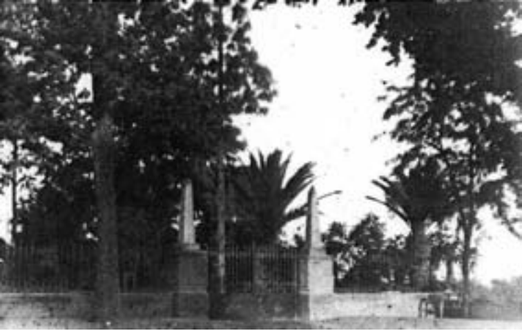
Entrada del jardín de la Glorieta a principios del siglo XX.