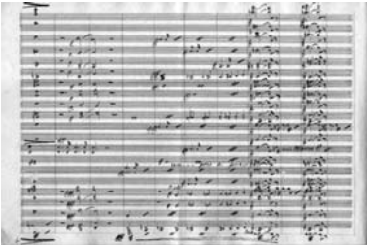
Orquestación de J.-P. Leive Márquez (2)