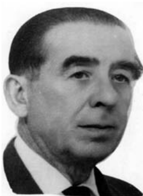
Leocadio Parras Collados, (Hellín, 1907–Madrid, 1973).