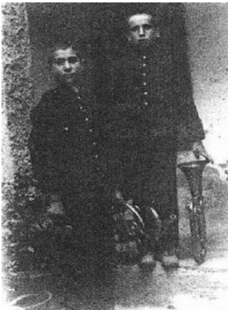
Dos jóvenes músicos de Hellín ataviados con los nuevos uniformes de 1889, sujetando una trompa y un bombardino.