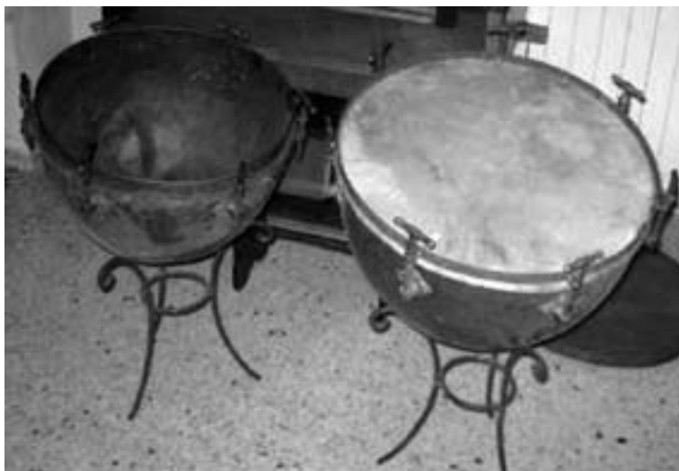
Los timbales adquiridos en 1948

nuevos instrumentos, como siempre con la previa consulta y petición de presupuesto a varias casas de música, muy parecida a la elaborada un año antes y con el mismo espíritu de superación, el deseo de disponer de lo mejor que hubiera en el mercado y con el apoyo que siempre tuvo del Ayuntamiento, la Banda consiguió un nuevo clarinete “Couesnon” y un saxofón tenor “Cleyton” 899 , además de la reparación exhaustiva de otros cuatro clarinetes 900 .