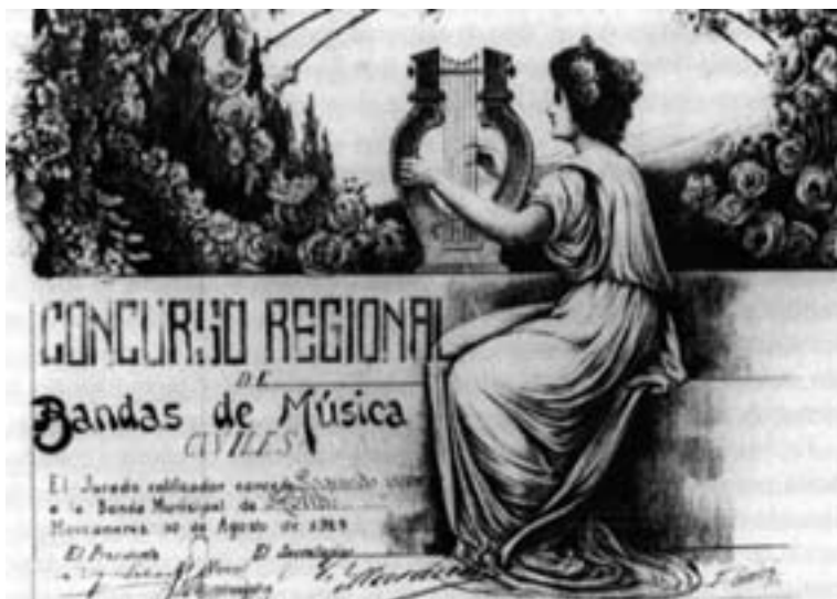
Diploma acreditativo del galardón obtenido en Manzanares. Original conservado en la actual Academia de la Unión Musical Santa Cecilia de Hellín.

después 692 , con lo que suponemos que se acabaría la discusión. El caso es que, después de mucho tiempo, la Banda Municipal de Hellín dio una gran alegría a sus fieles seguidores, y al pueblo en general que vibró con ellos y compartió los laureles del triunfo, ya que aunque se trataba de un segundo premio, se celebró como si hubieran sido los vencedores absolutos 693 .