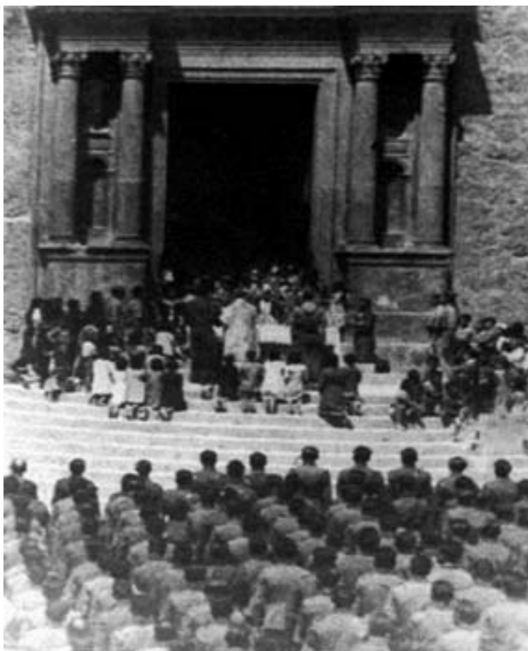
Misa de campaña con asistencia del Tercio San Miguel de la 5ª División de Navarra. Plaza de la Iglesia, 1 de mayo de 1939.

La Semana Santa de 1940 se celebró con cierta generosidad. Coincidió con la llegada de la nueva imagen de la Dolorosa 789 , desfiló por las calles una sección de caballería de Falange –no sabemos si con banda de música 790 –, se engalanó el pueblo y se anunció convenientemente 791 .