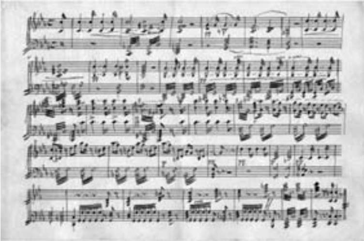
Original de piano