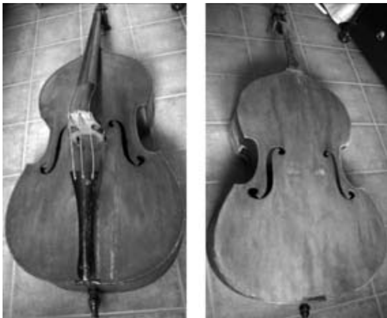
Contrabajos de tres cuerdas de la colección de Antonio Arcas Iniesta, utilizados en la Capilla de la Asunción. ( Propiedad de sus herederos )