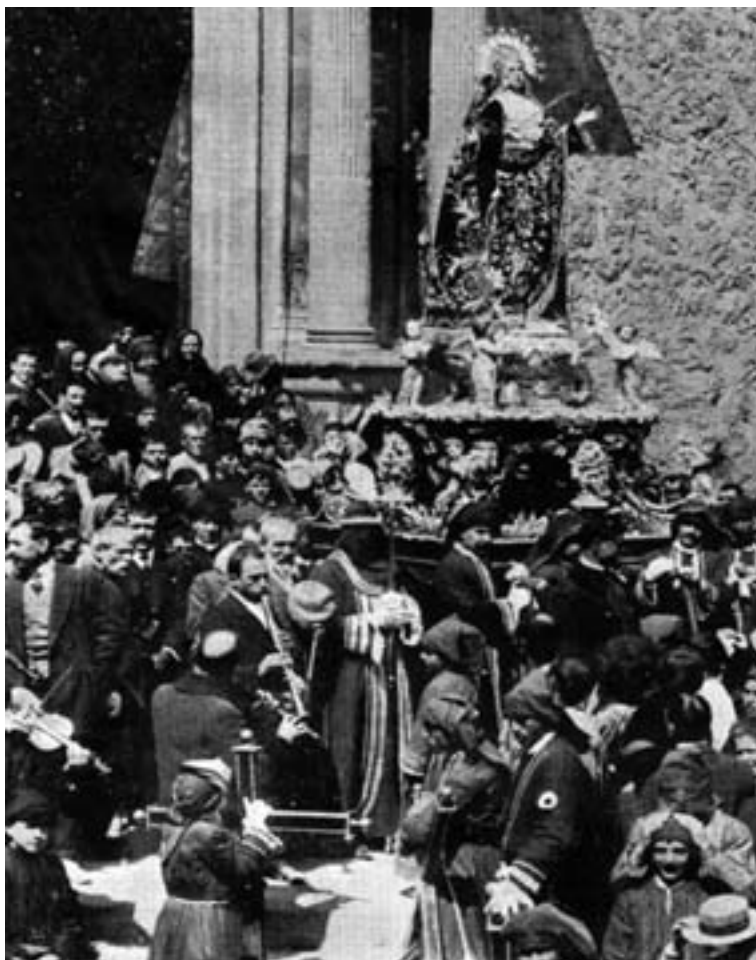
Alrededor de 1914. Violín, dos clarinetes y flauta travesera.