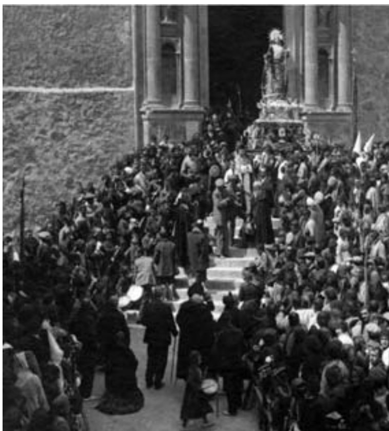
Viernes Santo de 1915. Tres violines, bombardino, clarinetes (en si b y bajo) y flauta travesera.