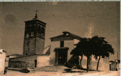
Parroquia Santa María (Villarrobledo)