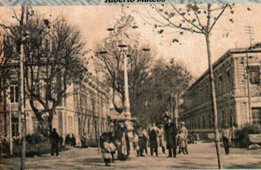
Farola en Plaza del Altozano (AB) Biblioteca Digital de Albacete «Tomas»