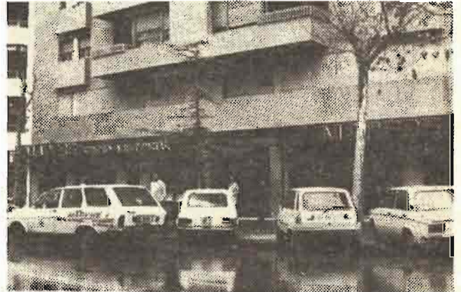
Ante la fachada de las nuevas instalaciones de "Mapfre", la ambulancia del Centro Asistencial, dispuesta para cualquier urgencia.

Las instalaciones del Centro Asistencial están dotadas de modernísimo material, desde Rayos X y quirófano para intervenciones que sólo requieran anestesia