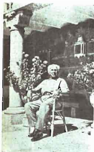
Benjamín Palencia, permanente actualidad en Albacete, lo fue últi-

LA CASA REAL SE INTERESA POR EL CURSO DE SU ENFERMEDAD