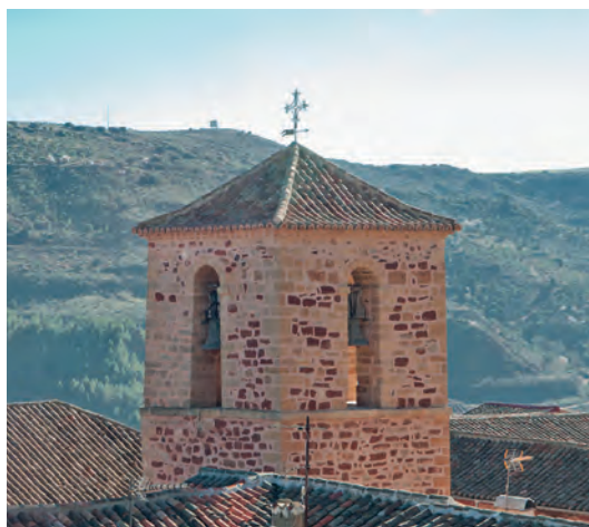
La torre de San Miguel