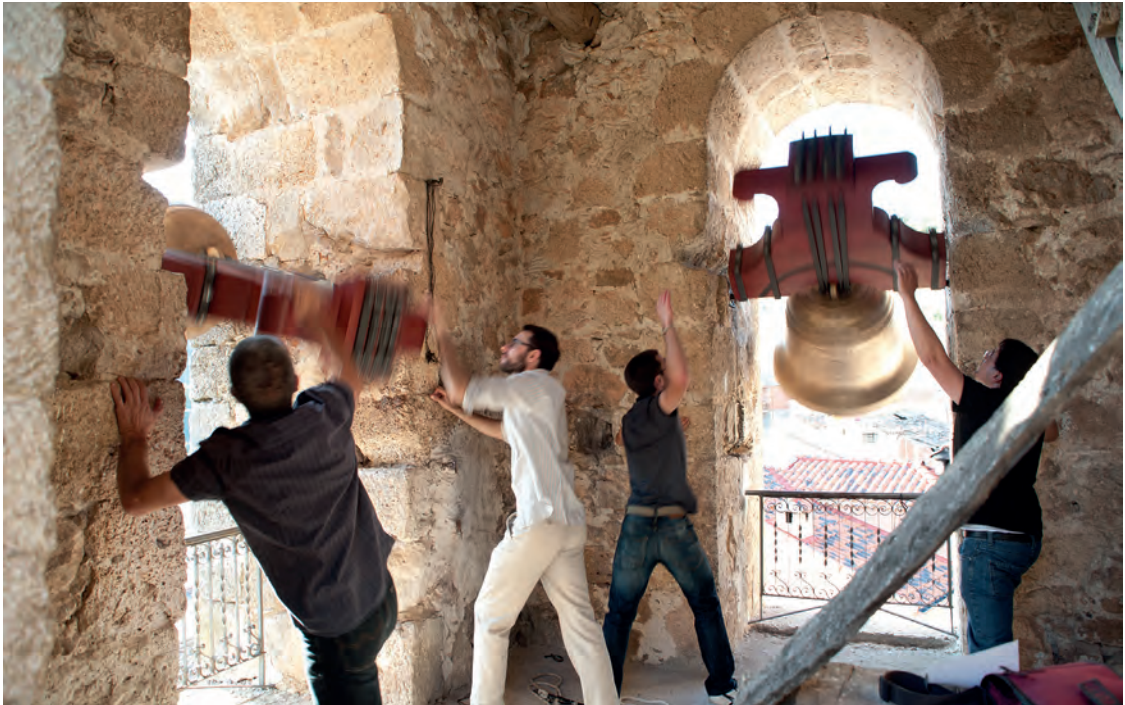
Campanas volteadas. Valdesaz, Guadalajara