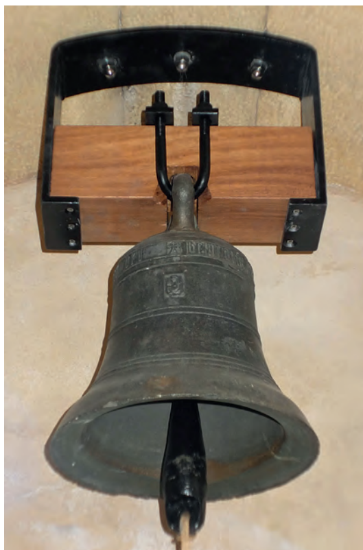
La pequeña campana de señales (s. XVI)

Es un bronce también muy bien conservado, que también posee epigrafía gótica, en este caso minúscula y alguna pequeña decoración. En la actualidad se encuentra colgada en una estructura nueva, manteniendo su badajo original. Una cartela apunta su datación en el siglo XVI.