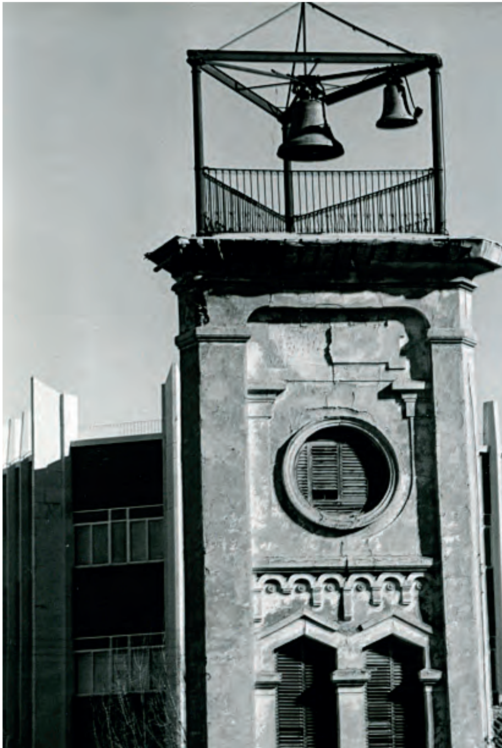
Torre en el Mercado de la Plaza Mayor de Albacete en 1981 antes de su demolición. Se ven aún las campanas de cuartos y horas colgadas.