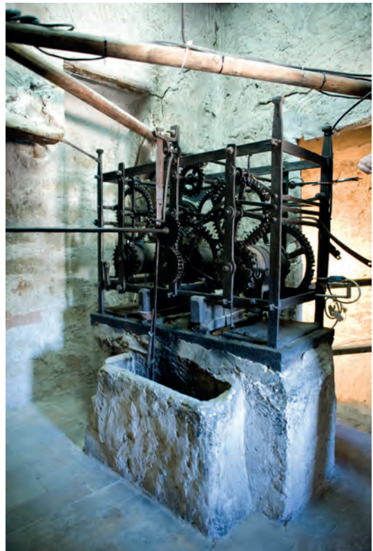
La preciosa maquinaria del reloj que se conserva en la torre de Santa Catalina

La sala de campanas, muy amplia cuenta con cinco vanos, uno por cada lado menos uno de los lados, que cuenta con dos de ellos. En todos ellos hallamos campanas.