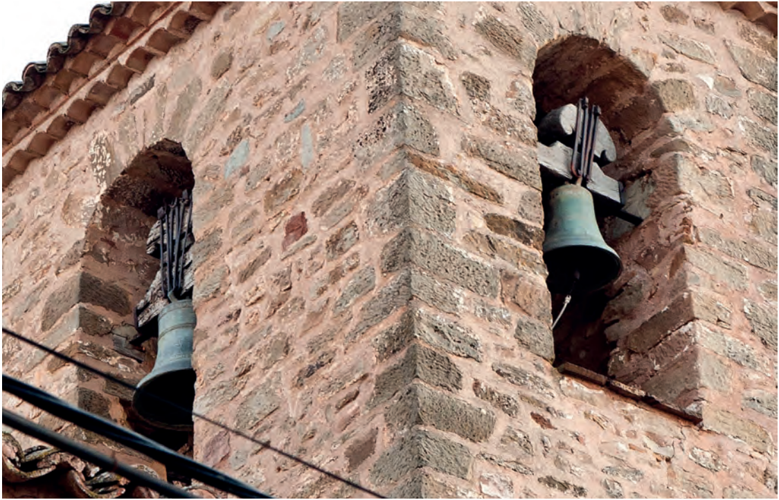
Las campanas más antiguas, que necesitan ser restauradas