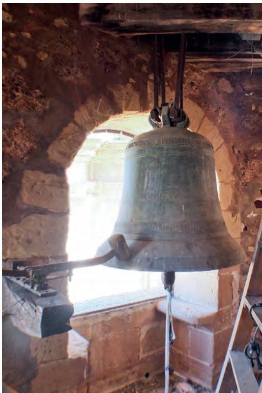
La campana de la Torre del Tardón (1447)

un estado óptimo de conservación, es una verdadera joya patrimonial. Hemos de percatarnos de que cuando la escuchamos llega a nuestros oídos la misma música que en 1447 cuando fue fundida. Todo un vínculo con el pasado de Alcaraz del que podemos disfrutar en el presente.