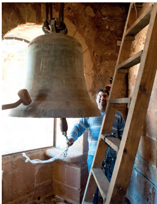
Tocando la campana del Tardón