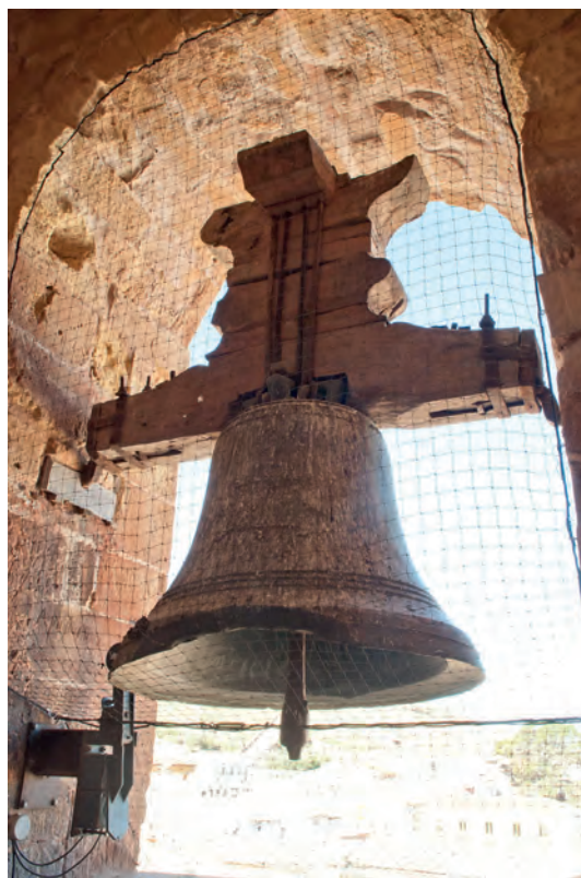
Instalación original y tradicional de la campana mayor de la Trinidad

Como acabamos de comentar, habríamos de encontrar nueva documentación o personas que nos confirmaran cómo se tocaban las campanas de la torre de la Trinidad. Suponemos que el volteo que se haría sería el de medias vueltas, por la instalación de la campana y por las notas de ADERFOR. Lo