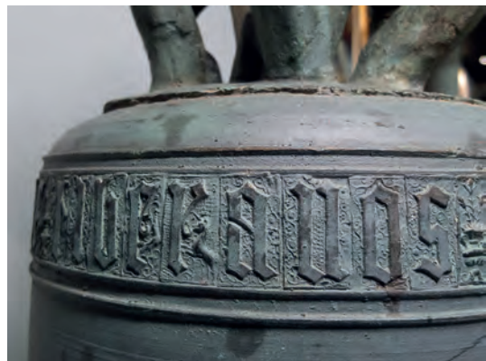
Detalles de la campana menor, la más antigua. Vemos la preciosa epigrafía gótica y ampliamente decorada que dice: ihs. mia. afulgure et tempestate liberanos domine. Que quiere decir: Jesús, María. Contra el rayo y la tempestad libranos Señor. (Sanchez 2003)