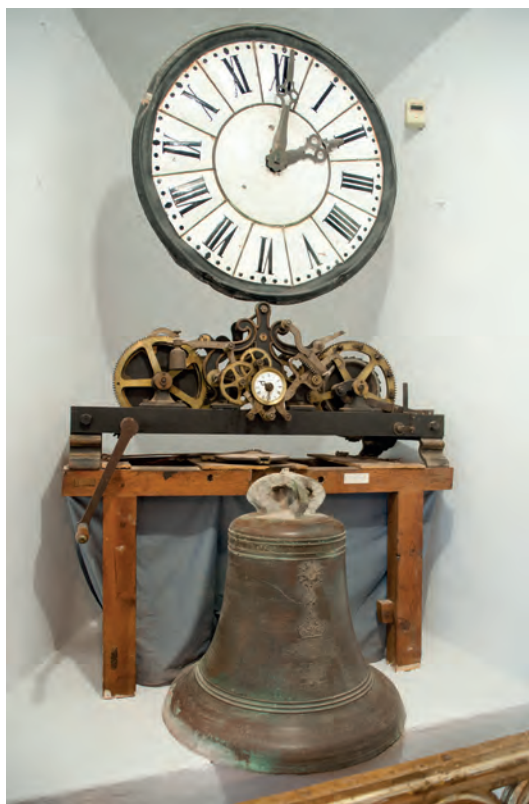
Maquinaria de Reloj y Campana de Horas de Liétor, expuesta en el Museo Parroquial, aunque estaba instalada hasta su sustitución en el Ayuntamiento

El avance es imparable y los fabricantes de relojerías se multiplican, vendiendo las maquinarias a ayuntamientos e iglesias de toda la península.