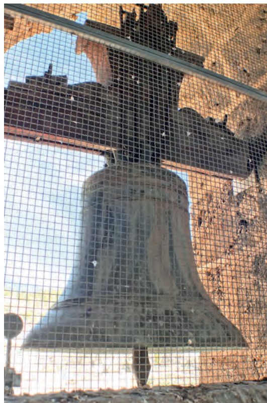
La campana “María”, quebrada

El conjunto de campanas es bastante heterogéneo, destacando la campana mayor, la María, antigua y que conserva la instalación original, aunque se encuentra lamentablemente quebrada. Su reparación es posible y debería acometerse, para evitar que la grieta siga creciendo a lo largo de la falda de la campana. Es realmente importante que esta campana no pierda su instalación fija, que no llegue a moverse y que su contrapeso sea igual si ha de ser sustituido en algún momento.