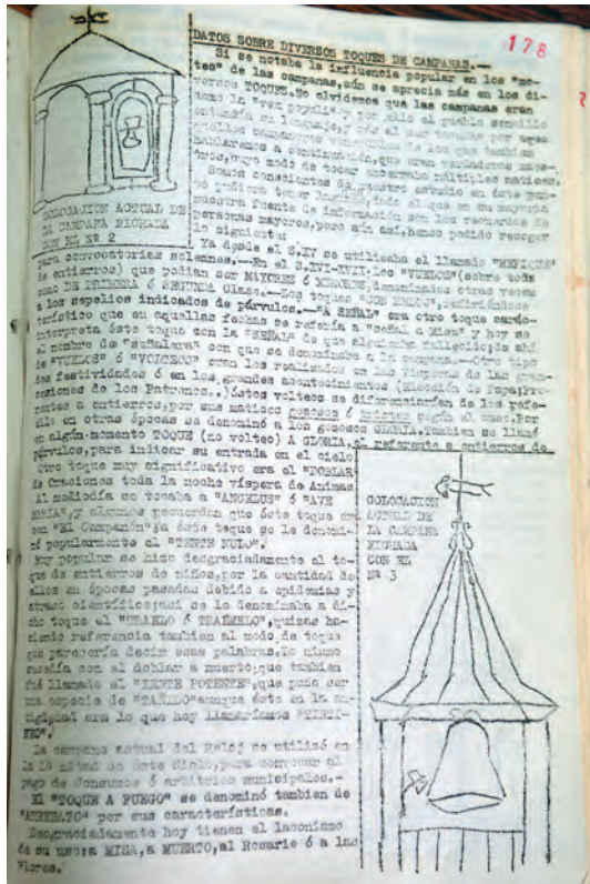
Extracto del artículo sobre las campanas y sus toques de Liétor. Uno de los únicos ejemplos que hemos visto de transmisión de los toques de forma escrita.

históricos. En muchas ocasiones formaban parte de las normas musicales de los templos para las celebraciones, y explican con minuciosidad el desarrollo de los toques.