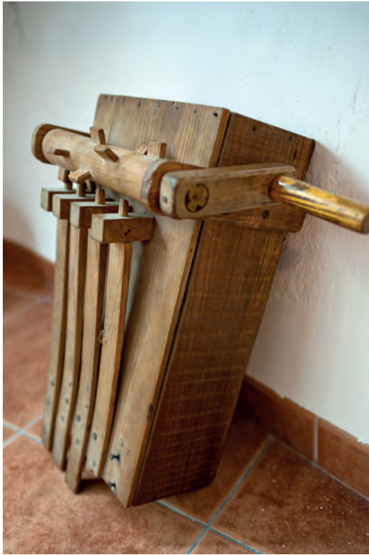
Matracas de mano en el Museo Parroquial de Liétor