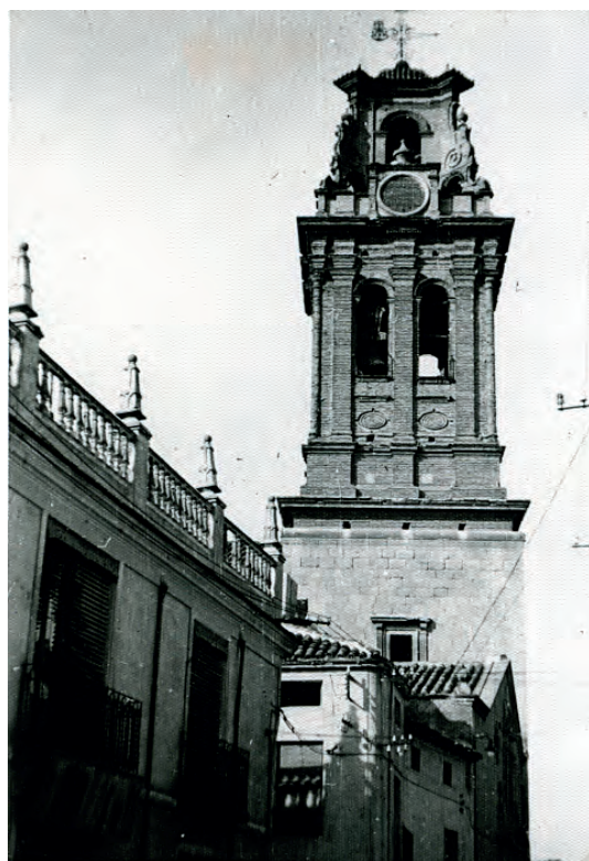
La torre, con las esferas del reloj en lo alto, sin la muestra, y la campana grande con su instalación tradicional a volteo.

en la entrada a la torre lo especifica. La construcción toma parte de la fábrica de la iglesia, en sillería. Los cuerpos superiores, el de campanas y el cupulín están realizados en ladrillo. El cuerpo de campanas se abre en dos vanos por cada lado. Y en el cuerpo superior se encuentra la circunferencia donde permaneció la muestra del reloj municipal hasta su traslado a una torre exclusiva para él.