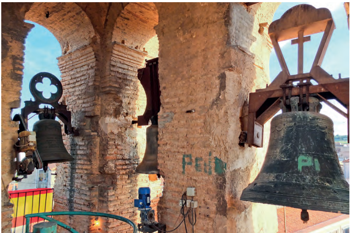
La fotografía muestra la instalación actual de las campanas, con yugos de hierro que modifican los sonidos y aumentan las vibraciones de las campanas. Además la motorización no puede reproducir los toques locales tradicionales, estando totalmente obsoleta.

El conjunto de campanas de esta torre no está compuesto por piezas antiguas, pero si que conserva una anterior a la Guerra Civil, que es la mayor, fundida por los Hnos. Roses de Valencia en 1925. La campana mediana resulta de escaso interés, fundida en el año 2000 y con el segundo contrapeso de hierro (que imita a madera) que tiene,