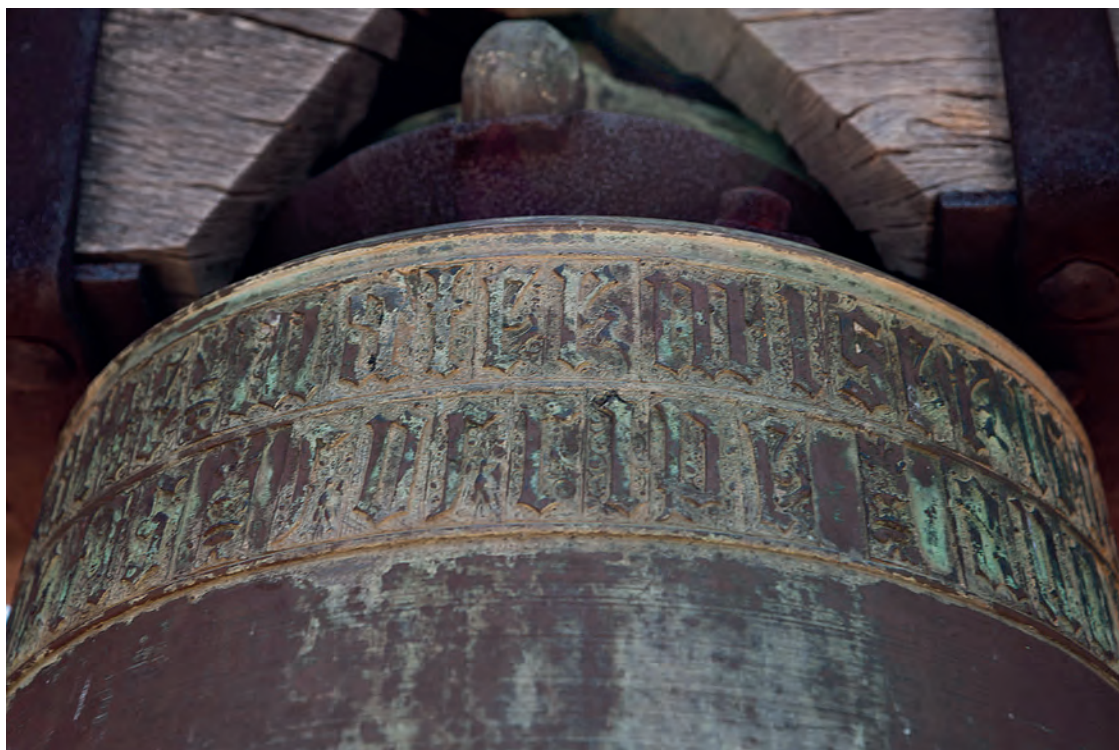
Epigrafía gótica minúscula de la campana mayor de Liétor, la María, datada en el siglo XVI

Si que debiera de acometerse alguna acción para revisar la madera del cabezal y los anclajes a los muros, ya que ninguna de