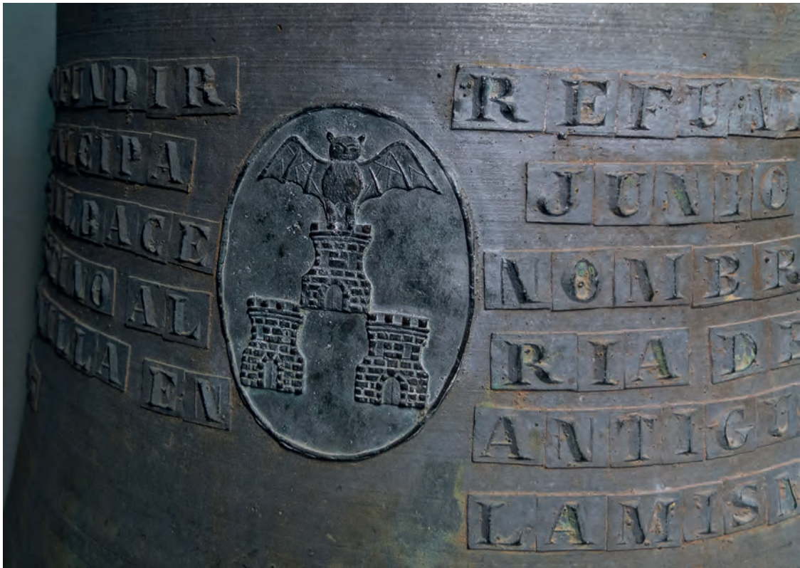
Detalle de la campana mayor de las dos municipales. En la inscripción se dice dedicada a Santa María de la Estrella, antigua patrona de Albacete y que fue refundida de la anterior. También se muestra un escudo de la ciudad.