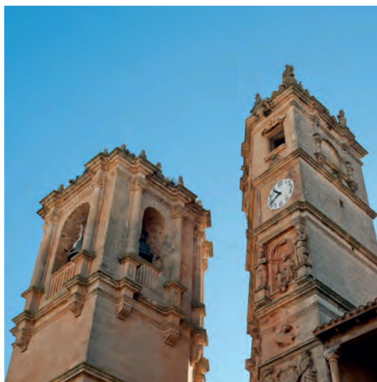
Las torres de la Trinidad (izquierda) y la del Tardón

Empezaremos el recorrido de las dos torres principales por la Torre del Tardón, bien reconocida por los lugareños y visitantes. Una obra de gran relevancia arquitectónica y artística y de carácter civil en la actualidad, aunque formaba parte del antiguo convento de los Dominicos.