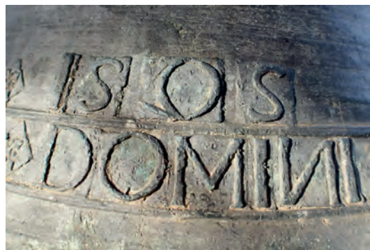
Detalle del año de fundición 1595 en la campana mediana “Nuestra Señora”

comienda restaurar de manera urgente para evitar posibles desprendimientos de las campanas. Los herrajes de forja están muy sueltos y la madera necesitaría ser intervenida o sustituida por una nueva con la misma forma y tamaño siempre, para garantizar la seguridad del conjunto. Se conservan pues las campanas “San Sebastián” y “Nuestra Señora”. La mayor de las campanas está dedicada al Santísimo Cristo y posee un contrapeso de hierro, que debe ser reemplazado por uno de madera, al igual que la única campana que se mueve, de factura moderna también y que debería recuperar una instalación con contrapeso de madera. Esta última campana, llamada “Hermano Francisco”, no entra en los repiques tradicionales. Las tres campanas que normalmente se utilizan están electrificadas para ser tañidas mediante un sistema informático con electromartillos, que golpean a las campanas, pero que no reproducen los toques locales.