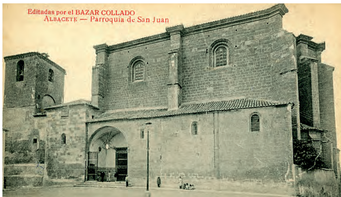
En esta imagen, observamos la primera torre del templo de San Juan. Por lo que podemos observar las campanas están instaladas para permitir su movimiento, no solo repicadas

La torre, de planta cuadrada con gruesos muros, presentaría un espacio mayor que el resto de las capillas en su primer cuerpo, que suponemos destinado a baptisterio, ya que como dijimos anteriormente la pila