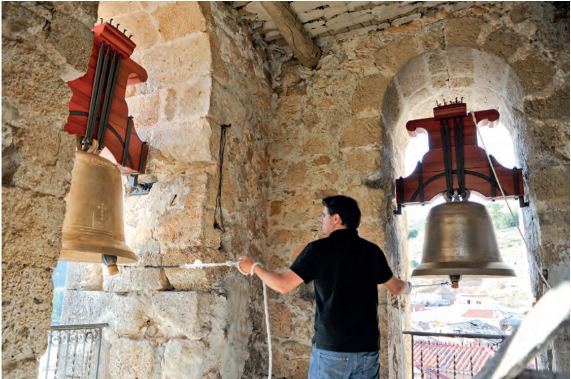
Campanas repicadas. Valdesaz, Guadalajara