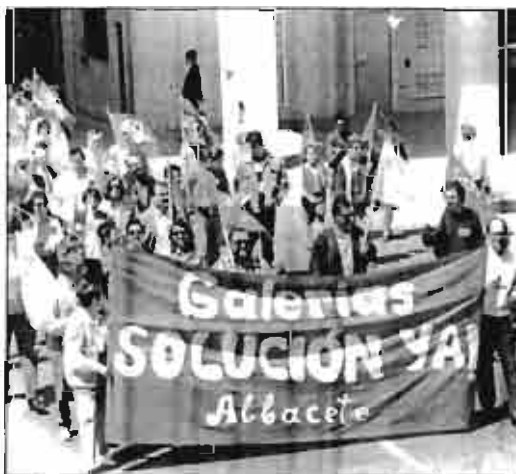
Fin a la incertidumbre y a las movilizaciones.