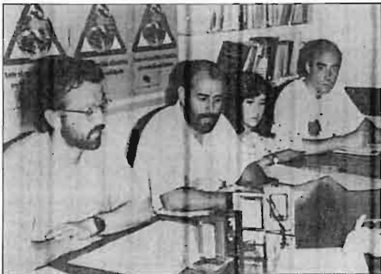
Presentación de las firmas de la ILP antinuclear.