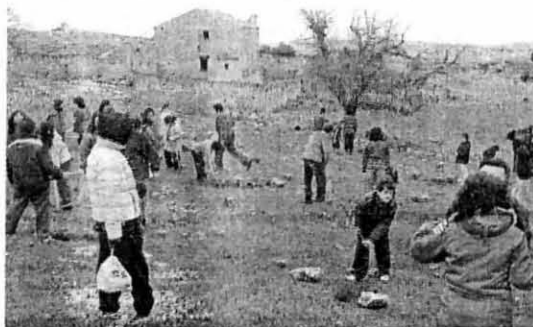
UNA TRADICIÓN. Un momento de la repoblación simbólica llevada a cabo ayer en la sierra de Chinchilla, cerca del campo militar.