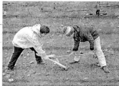
MANO A MANO. Dos jóvenes cavando. /LV