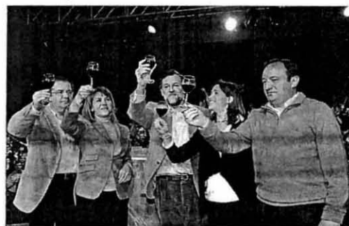
RAJOY, EN DEFENSA DEL VINO. Los dirigentes del PP, ayer, en un acto celebrado en Ciudad Real en defensa del vino.

El sindicato UGT de Albacete ha participado activamente en la II Feria de Formación y Empleo que se ha celebrado en la ciudad en el recinto ferial del IFAB, en la carretera de Madrid. Al igual que ocurrió en la I Feria, el stand de UGT Albacete fue uno de los más visitados, contando este año con más de 1.600 visitantes, principalmente alumnos de distintos centros formativos de nuestra provincia que están en sus últimos años de formación y comienzan a plantearse su futuro profesional.