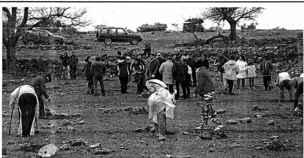
ACCIÓN SIMBÓLICA. Los participantes en la repoblación del campo de tiro plantaron 200 arbustos de tomillo, coscoja y esparto.