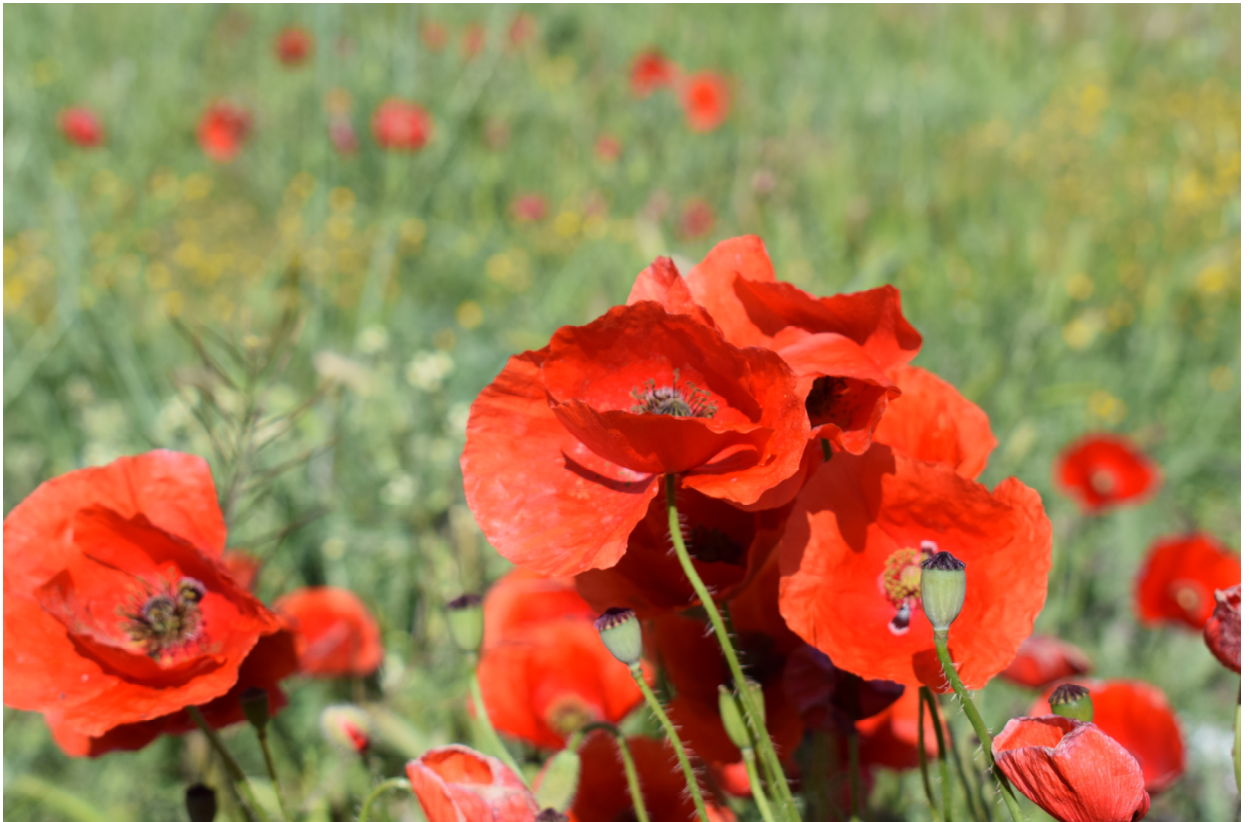
Ampolas silvestres. Autor: Carlos Navarro Honrubia