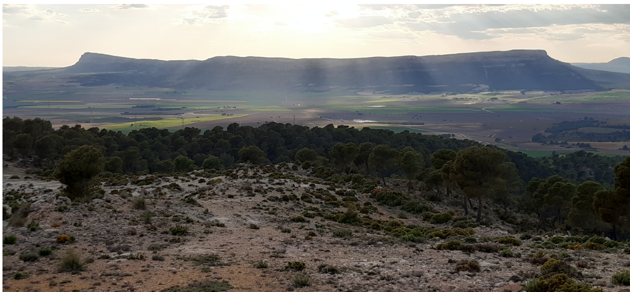
Almansa (Albacete). El Mugarón.