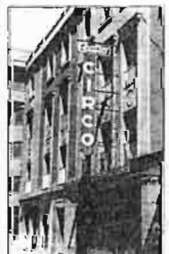
El repleto del Teatro Circo.

► El director general de Cultura demostró ayer, sin dudar, una sensibilidad exquisita al decir que igual da tardar unos meses más que antes en arrugar el Teatro Circo. Después de los años que lleva cerrado el local, erudiendo ratos y deteriorándose a machos forzados, decir eso es de una irresponsabilidad suprema.