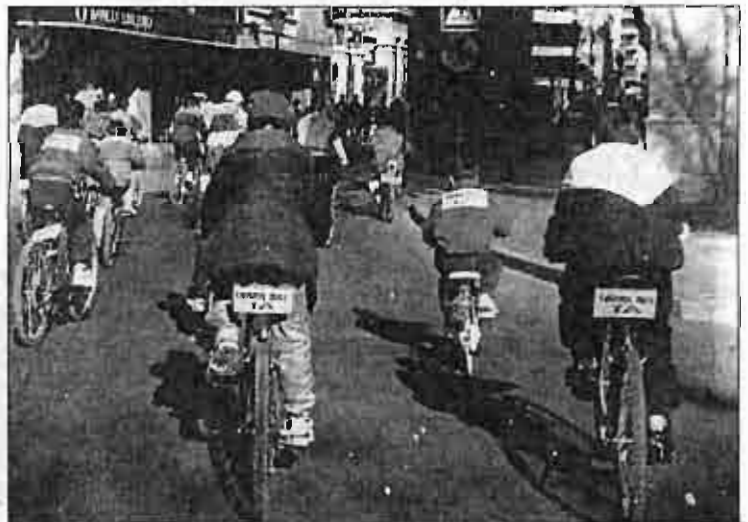
Hoy tendrá lugar la sexta marcha reivindicando lúdicamente el carril-bici.

Según manifestó el portavoz de los colectivos, "se ven llegar las elecciones y constatamos por lo no hecho que se ha decidido olvidar el proyecto de