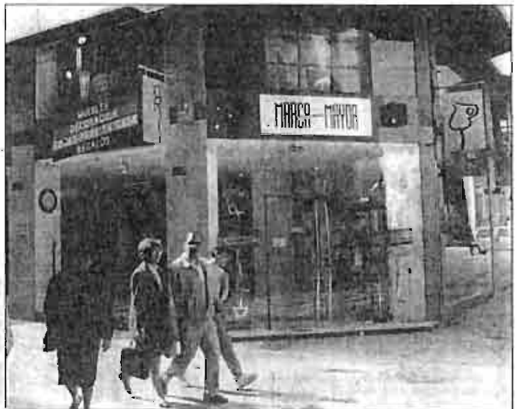
Las valoraciones de la CECAM buscan proteger los intereses de comerciantes e industriales.

Las aportaciones de la CECAM buscan proteger los intereses de industriales y comerciantes, dotando a la ley de seguridad jurídica,