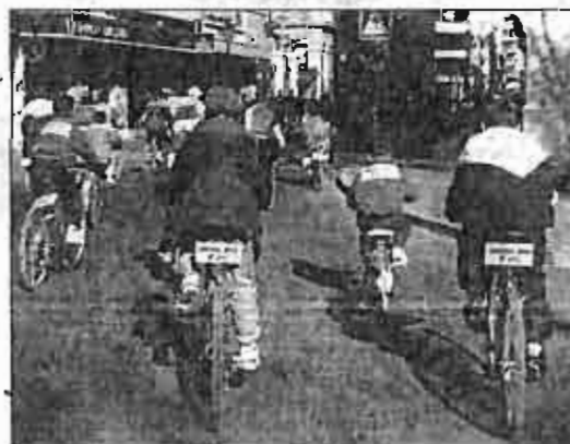
Ningún colectivo ha hecho aportación alguna al proyecto del carril-bici.

Por otro lado señalar que una empresa de Madrid ha solicitado al Ayuntamiento información sobre el tramo de