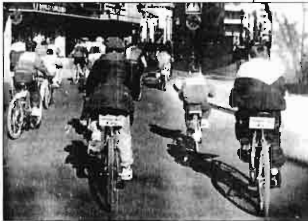
Los concentrados eran pocos, pero hicieron notar su presencia.