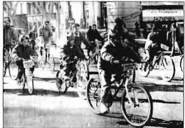
Los más jóvenes también solicitaron la instalación del carril-bici.