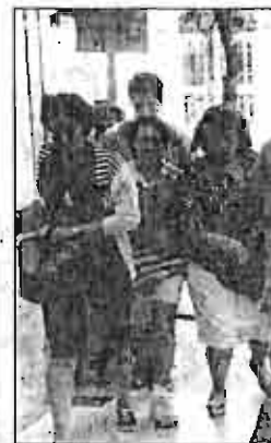
Aperturas en Galerías.

► Entre tanto, los políticos, con la cazadora electoralista de fin de semana, se dan baños de multitud. Se levanta la veda del voto y encuestas. ¿Les suena?