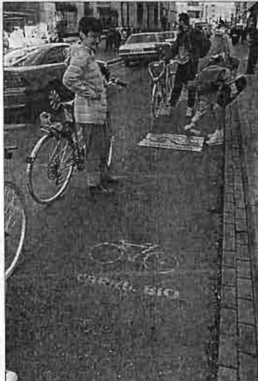
Mucho ruido y pocas nueces con el carril-bici.

Adeca explicaba en su propuesta que el carril-bici llegara hasta el polígono, consecuencia de las peticiones de empresas y trabajadores lle-