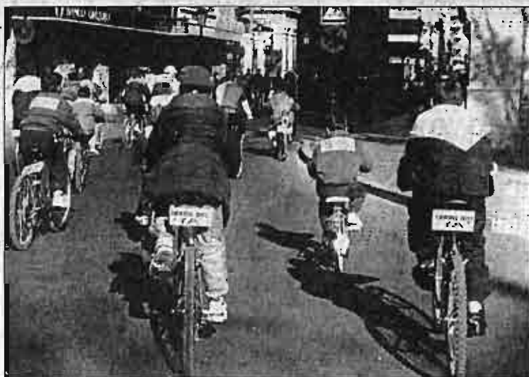
El aumento del número de muertos en accidente de bicicleta fue espectacular.

Castilla-La Mancha ocupa el tercer puesto nacional