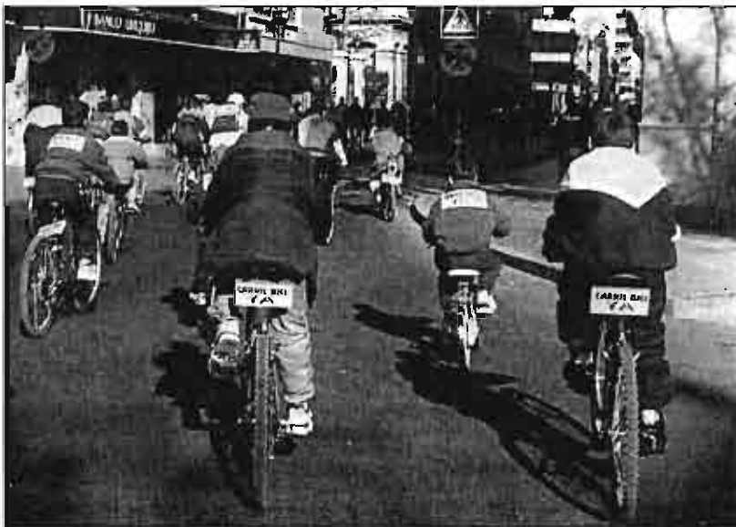
El proyecto del carril-bici cuenta con respaldo para convertirse en una realidad.

Izquierda Unida se planteó la sugerencia de trazar algún recorrido radial, que permita unir los barrios con el centro de la ciudad, ya que pese a la dificultades técnicas que ello pueda entrañar es imprescindible establecer una vía de acceso hasta el centro, ya que "uno de los objetivos del proyecto debe ser el de diversificar los medios de transportes que se utilizan para llegar hasta las calles más céntricas".