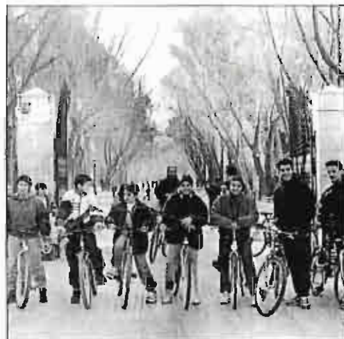
Ayer, manifestación para pedir el carril-bici.

De todas formas, con un Centro más peatonal, será más sencillo circular en bicicleta por Albacete; el carril-bici, que tantos colectivos solicitan en estos momentos, sería la culminación perfecta.