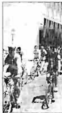
Otra "marcha" de bicis.

Por ello reivindican la bicicleta como la alternativa de transporte individual, "más coherente y apropiada