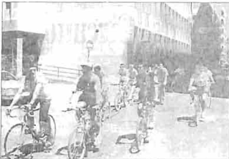
El PP considera viable en otros momentos la implantación del carril-bici en la ciudad.