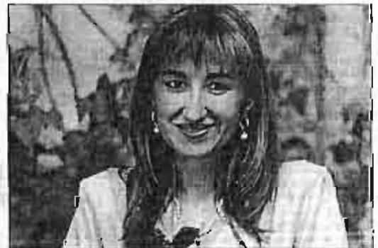
La concejala de Educación no encuentra muchos apoyos.

Las CCP piensan que con esta medida se pretende financiar con dinero público una iniciativa privada, lo cual es más grave cuando