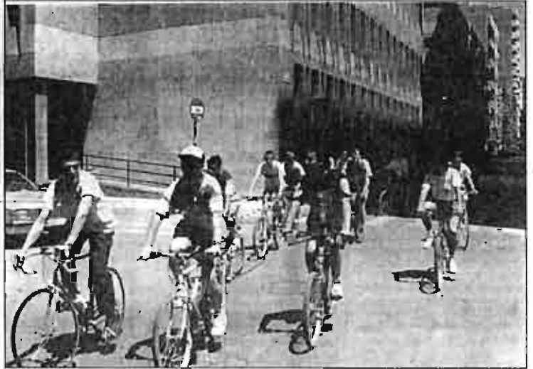
Todos los primeros sábados de cada mes, marcha en bicicleta saliendo del Parque a las 12 del mediodía.

Las pocas actuaciones que en materia de tráfico ha acometido la actual Corporación, no han sido del todo acertadas, según señaló Pérez Pena, ya