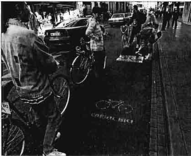
Los ecologistas han protestado en varias ocasiones solicitando el carril-bici.