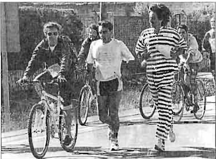
Un ejemplo. La imagen de los dos marchadores y los ciclistas restantes corresponde a una marcha con motivaciones sociales, pero viene a ser también un ejemplo de cómo agradecerían los chaladanos que se desahucen por las calles albacetinas. No hay excesiva polución, poca sobran ruedas de vehículos. Andando o en bicicleta todo se ve mejor y con más tranquilidad. FOTO NOTICIA

etc., pues buscar nuevos horizontes para salir de su estancamiento. Y los García, Martínez, Pérez, etc. en tiempos no muy lejanos, pues emigrar a Francia, Alemania u otro país en busca de "jobs". Por todo ello, los pueblos terroristas