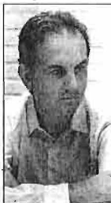
Fructuoso quiere repetir.

La lista presentada por el PSOE ofrece en principio