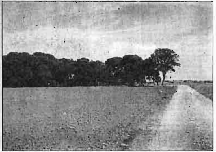
Aspecto parcial de la finca "El Pilar", en Tarazona de La Mancha.

En este sentido la organización ecologista exige la dimi-