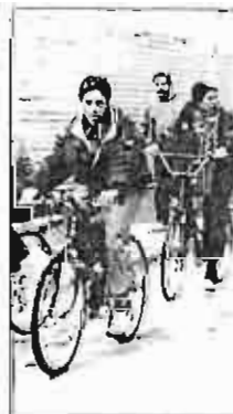
Marcha en bici.

Los ecologistas y grupos cívicos que apoyan esta campaña reivindican el uso de la bicicleta como la opción de transporte individual más coherente y apropiada para nuestra ciudad.