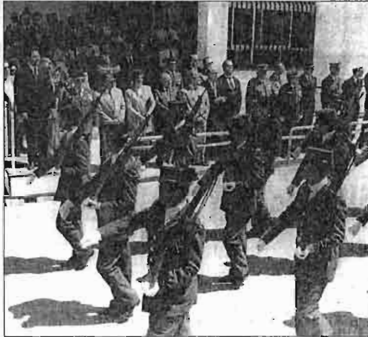
Nuevo homenaje a la Guardia Civil.

Para el día 8 de abril, esta Delegación de Caza ha organizado una cena en un restaurante de esta ciudad, en la que se otorgarán diplomas a los campeones provinciales en el año 1994 de las distintas