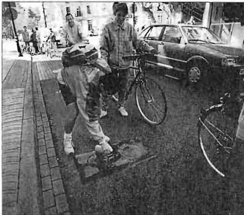
Los ecologistas, con las manos en la masa.