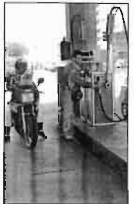
Subirá la gasolina.

El PP aventaja en 8'3 puntos al PSOE, según una encuesta del CIS