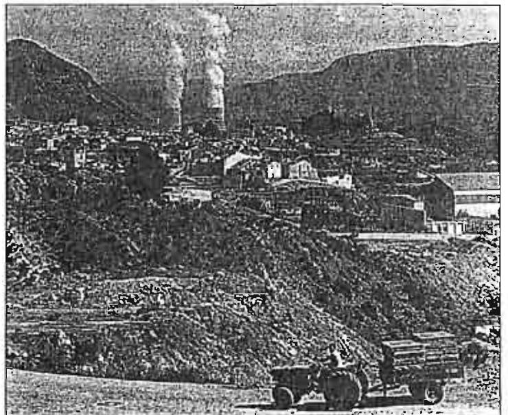
La Coordinadora Antinuclear de Cofrentes critica la forma de producir energía eléctrica en esta central.

La Coordinadora Antinuclear de Cofrentes, "ve muy peligrosa la situación creada en la Central