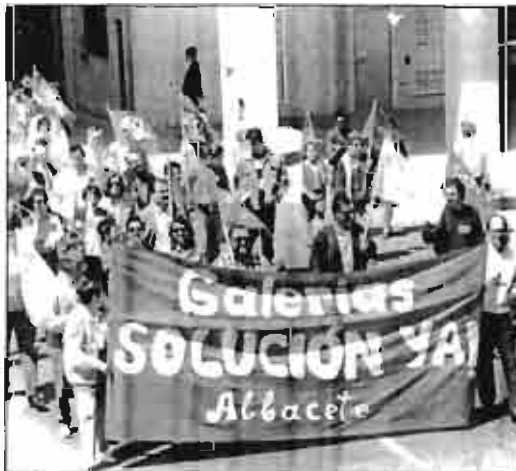
Fin a la incertidumbre y a las movilizaciones.