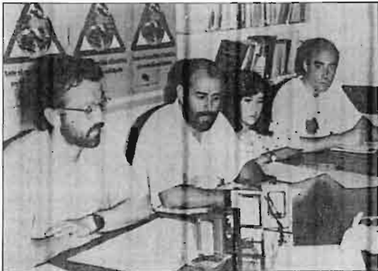
Presentación de las firmas de la ILP antinuclear.