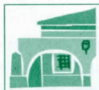
BULEA DE ECOLOGÍA DEL PARQUE GALILEO SÁNCHEZ