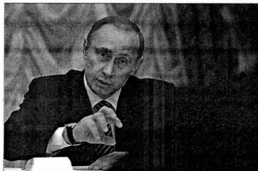
Vladimir Putin atiende a un mandatario europeo, ayer en Moscú.

próximo. Sin embargo, los iraníes han destruido esta tesis al lanzar esta semana un nuevo misil que ha causado preocupación incluso en Rusia. Además, Gholamreza Ansari, embajador de Teherán en Moscú, anunció ayer que su país lanzará un satélite en marzo.