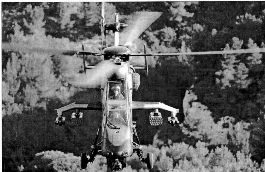
Un 'Tigre' de la versión HAP, la misma que opera en el Batallón de Helicópteros de Almagro.

ASIA, MERCADO ESTRATÉGICO PARA EUROCOPTER