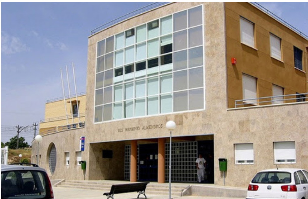
Fotografía del IES Herminio Almendros, en Almansa (Albacete).