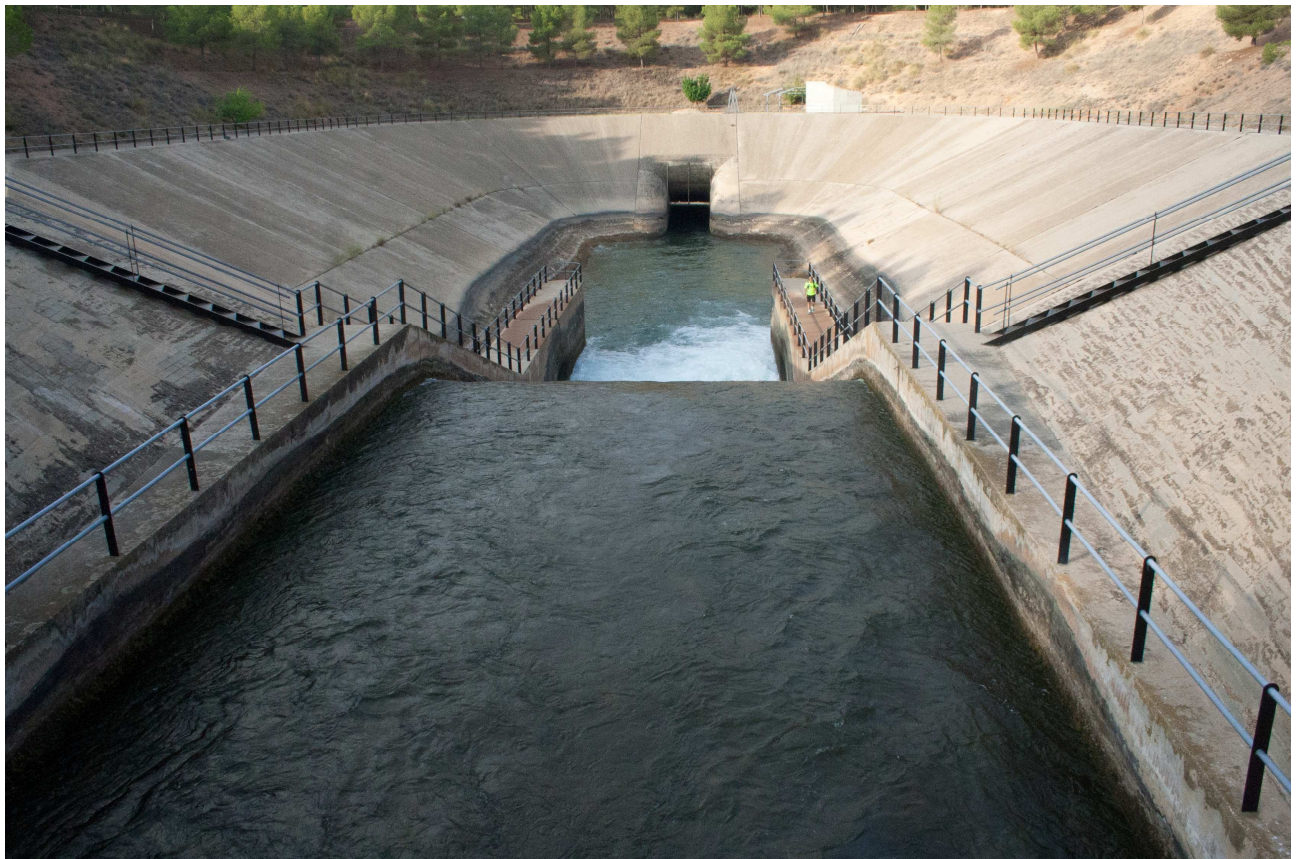
Túnel del Talave. Acueducto Tajo-Segura, Los Anguijes