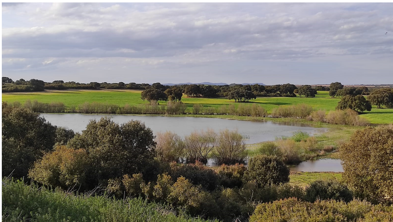
Lagunas de La Higuera, Corral Rubio (Albacete).