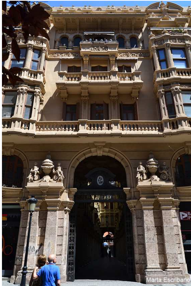
Calle Tinte