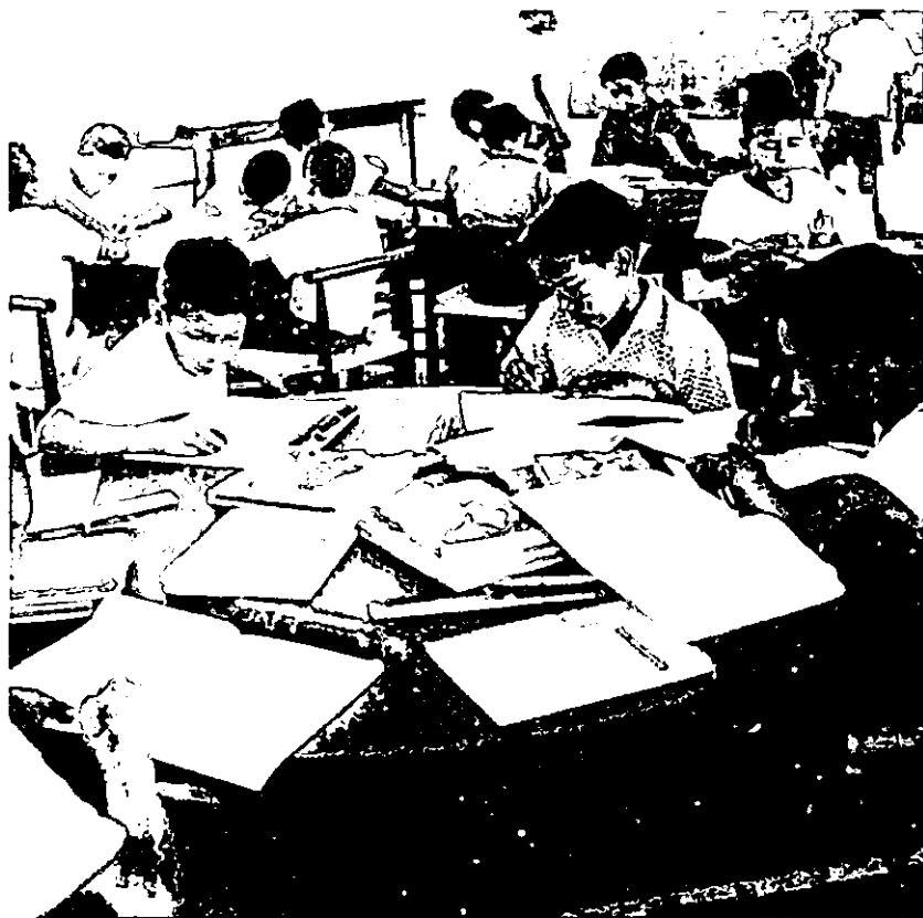
Ciudad Escolar Camilo Cienfuegos, provincia de Oriente, Cuba, 1960.