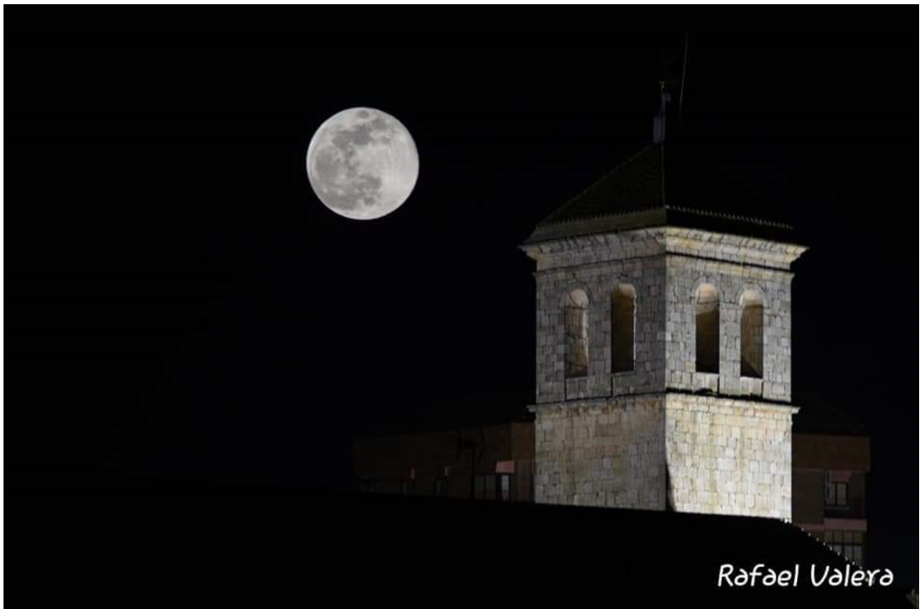
Iglesia de Villamalea (Albacete)