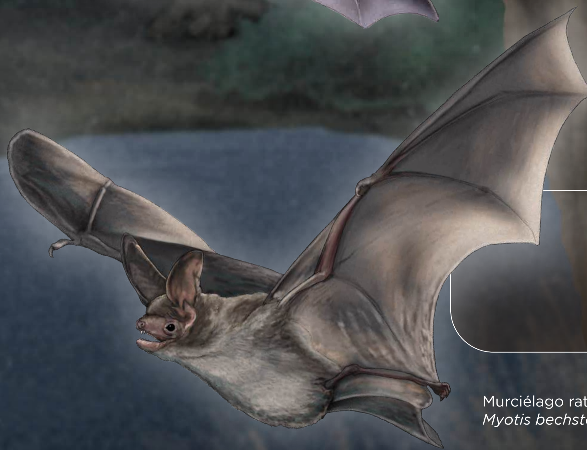
Murciélago ratonero forestal (Mb) Myotis bechsteinii

Algunas especies, como el murciélago ratonero forestal, aprovechan también los huecos de pícidos para cobijarse o criar.