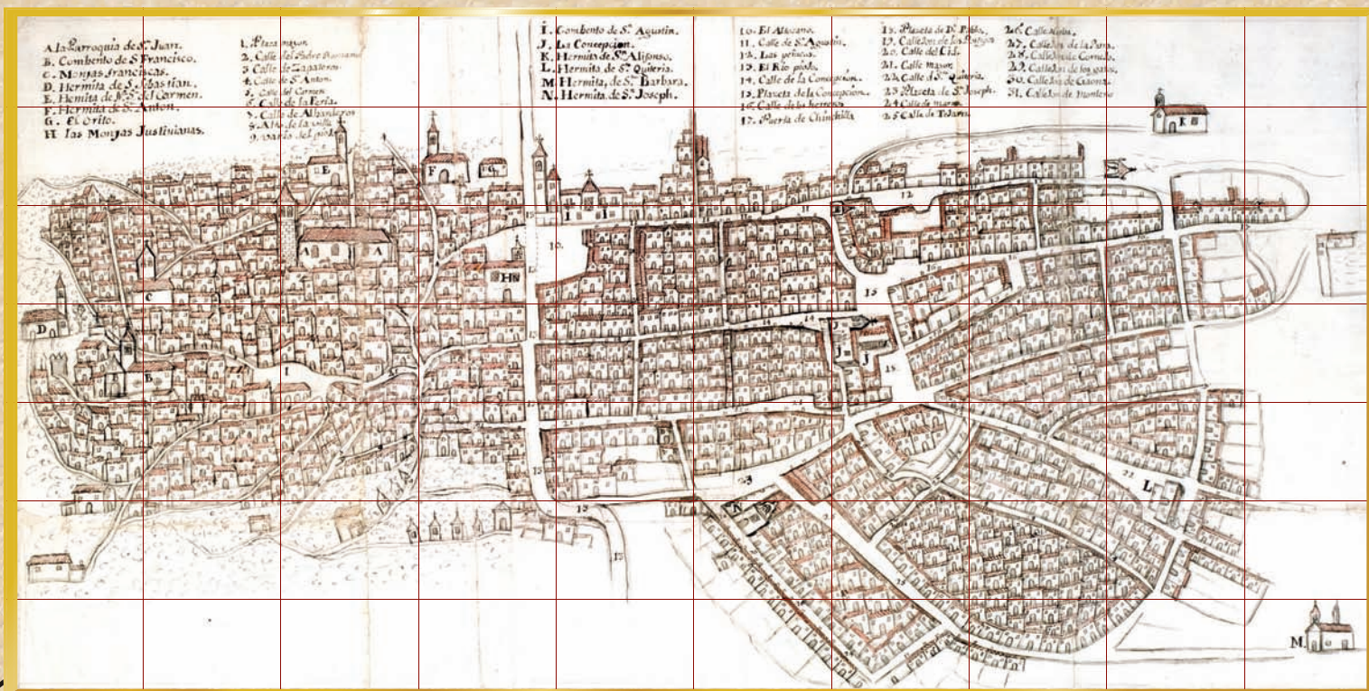
ALBACETE en 1767

Instituto de Estudios Albacetenses “Don Juan Manuel” de la Excm. Diputación de Albacete