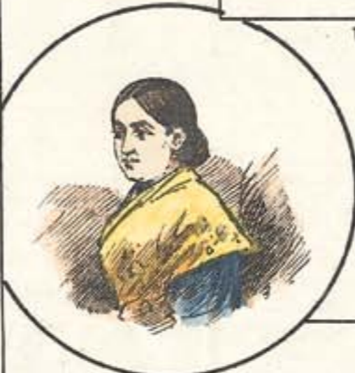
Dios la conserve.