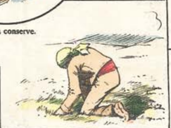
En el azafranal, cojiendo topos