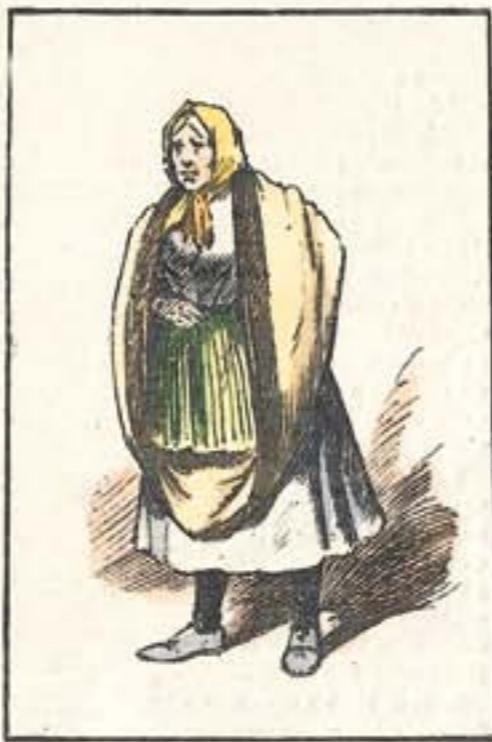
Una dama albacetense.