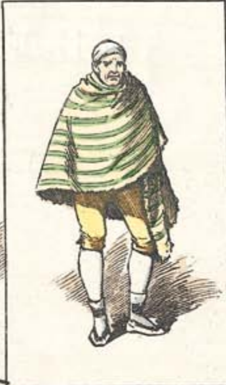
Un tipo clásico.