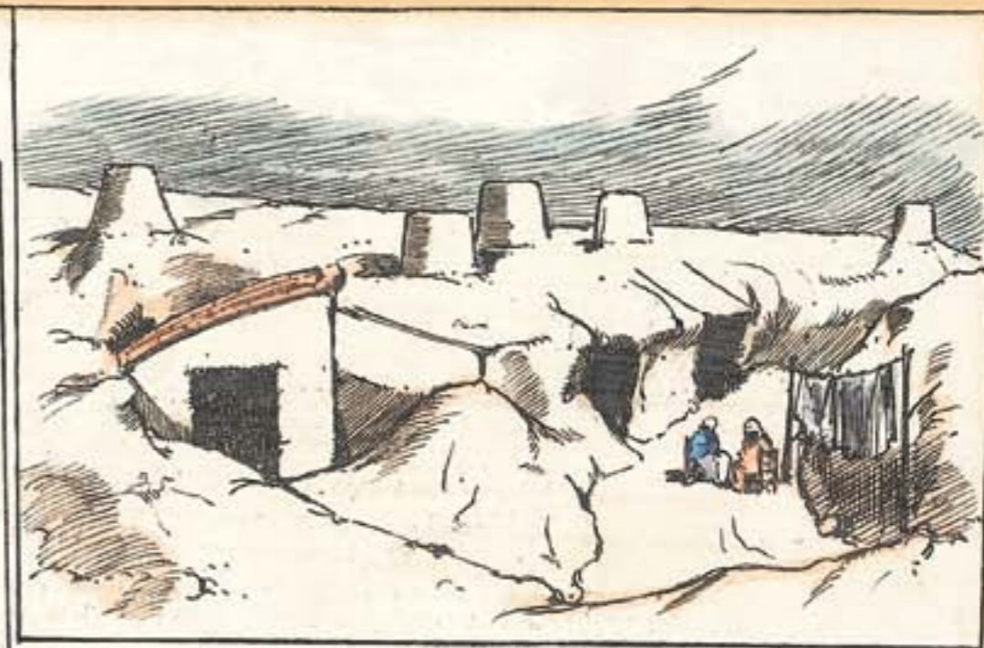
Los chalets del ensanche de la puerta de Valencia