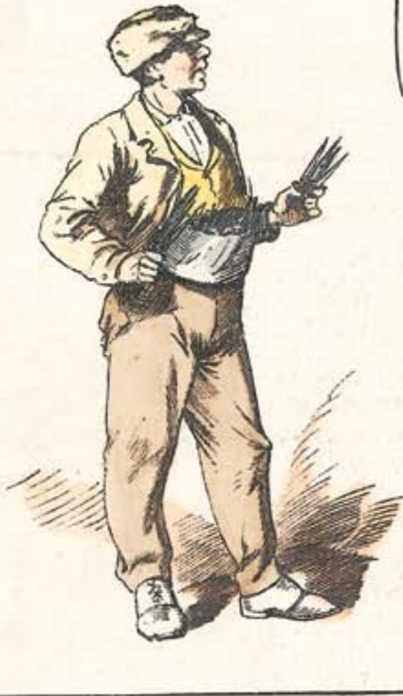
Navajas y puñales.