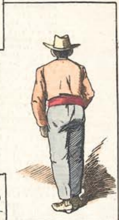
Un flamenco de por acá.