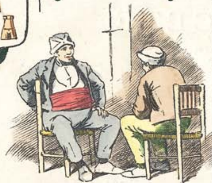
Hablando de la langosta... ¡como si lo estuviera viendo!