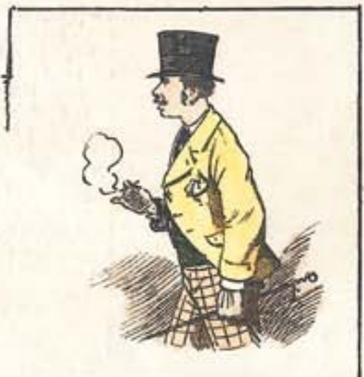
Al paseo de la Cuba, á no dejar un corazón sano.