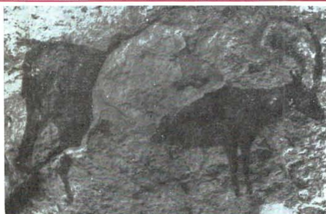
He aquí un ciervo fielmente reproducido por artistas rupestres de nuestra provincia; quizás, hace 7.000 años.

recientes, puede afirmarse que nuestra provincia es la primera de España en riqueza rupestre. Acaban de ser localizados nuevas e importantes muestras, que ofrecemos en exclusiva en páginas interiores.