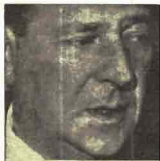
Don Juan de Borbón

Los Condes de Barcelona agradecen a CRONICA un artículo sobre el futuro Príncipe de Asturias.—Pág. 29