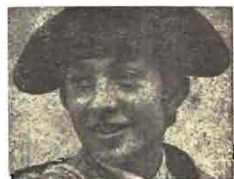
NIÑO DE LA CAPEA

EN PAGINAS INTERIORES, COMENTARIOS CRITICOS A LAS PRIMERAS CORRIDAS DE FERIA