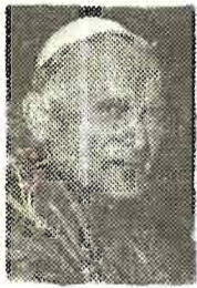
Juan Pablo II

SI LA IGLESIA QUIERE SER FIEL AL PENSAMIENTO