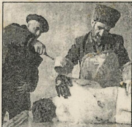
Dos hombres, ante el cadáver de un azerí.