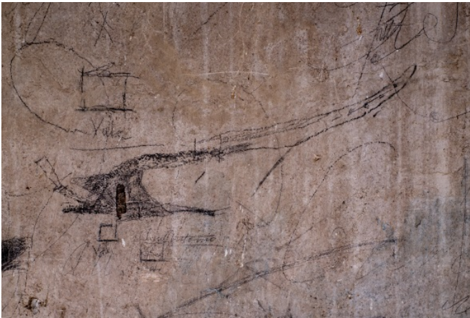
Grafitis en el cuarto de los fuelles del órgano, realizados durante la Guerra Civil. Arriba, una vertedera, y abajo, un arado. Año 1938. (Fotos: Javier Tejada).