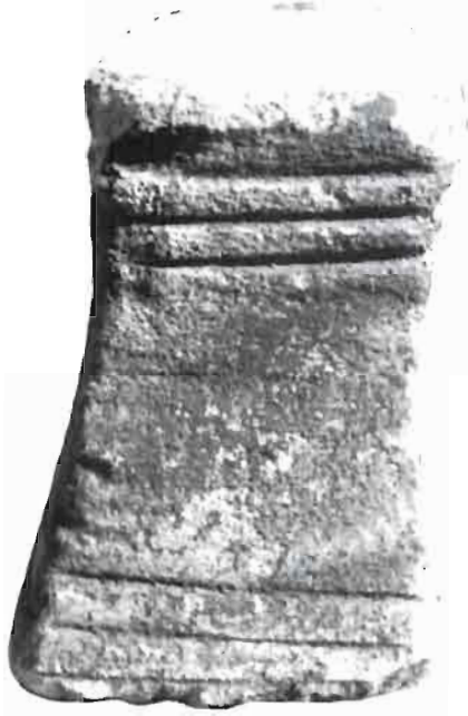
Lámina I. Cerro de los Santos. Ara votiva.