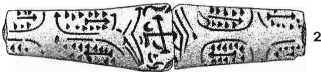
Figura 1: Anillo visigodo de Alpera. 1: tamaño natural. 2: aumentado.