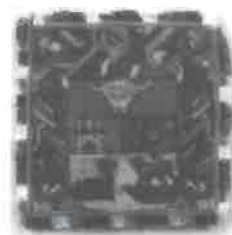
TERNOS BLANCOS. Anónimo. Siglo XVII. Tejido. Medidas: desconocidas. Exp.: Sevilla, 1929. Núms. 998, 1.024, 1.025, 1.057. No conservado.

Este curioso terno blanco procedía de la parroquia de la Asunción y, desafortunadamente, no se conserva. Se trataba de un buen conjunto de tela de seda blanca rameada con florecillas, mientras que las cenefas de la casulla, faldones, mangas y collarines de las dalmáticas eran a base de un rico tejido de cañamazo con motivos vegetales que recuerdan algunas formas de las alfombras y tapicería. Es interesante advertir que el conjunto incluía una bolsa de corporales, también hecha de tejido de cañamazo y en este caso con un escudo de armas de un linaje desconocido que podría relacionarse con el de los Cabeza de Vaca y quizá Coello de Portugal. Este blasón, del que desconocemos los esmaltes, traía una irregular partición, con una cabeza de vaca colocada en jefe; un partido en faja, con un castillo y las quinas de Portugal; y en punta, una desconocida pieza y un león. Al timbre, un yelmo con sus lambrequines.