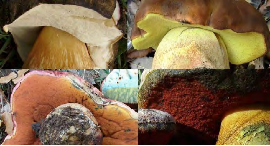
Figura 1. Diversidad de colores del himenio en Boletus sensu lato.

blanco, amarillo, anaranjado o rojo (figura 1). A menudo, el color de los poros varía con la maduración del cuerpo fructífero. El himenio es adnato (pegado al pie) cuando los ejemplares son jóvenes, con la edad puede terminar siendo semilibre en ejemplares muy viejos.