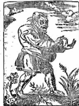
EL SAOPE, LA VIRTUD Y LA PRUDENCIA DIERON A LA MAS PBA CRIATURA NO NOS PIRMOA NUNCA EN LA FIGURA QUE ENGANA MUCHAS VECES LA ATENCIONA.