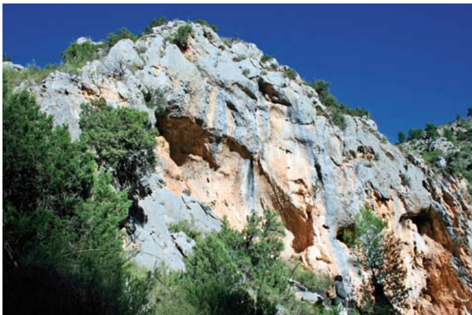
Figura 2. Abrigo del Cornibeletto I.