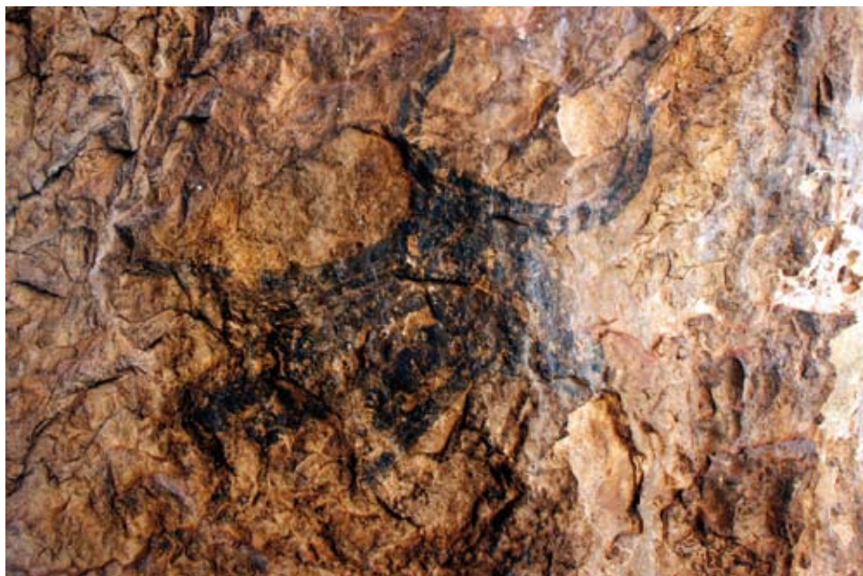
Figura 5. Abrigo del Cornibeleteo. Panel 1, prótomos de bóvido.