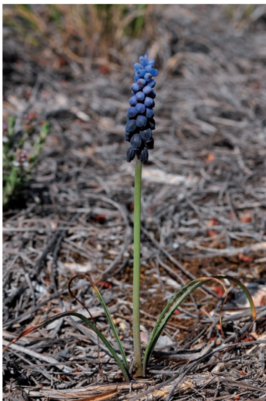
Fig. 12. Muscari atlanticum.